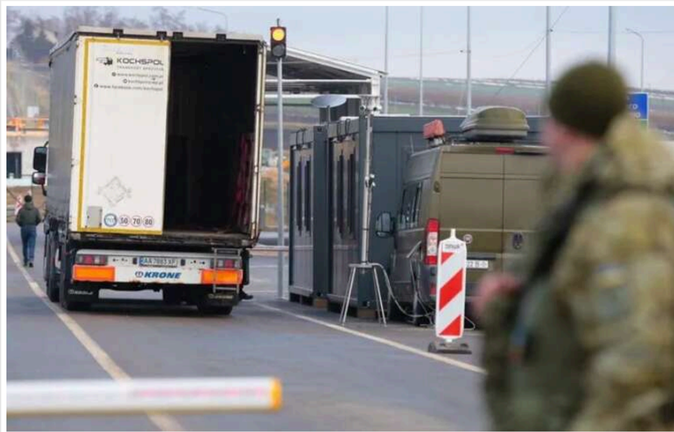
Польща змінила правила для вантажівок з України, зробивши їх більш жорсткими

З 1 листопада 2024 року Польща послила контроль за автомобільними вантажоперевезеннями для українських та інших експортерів. Відтепер водії з третіх країн (не ЄС) з будь-якими вантажами перед в'їздом до Польщі повинні реєструватися в польській системі SENT. Це може викликати проблеми для українських логістів і тимчасові труднощі з постачанням, попереджають учасники ринку.