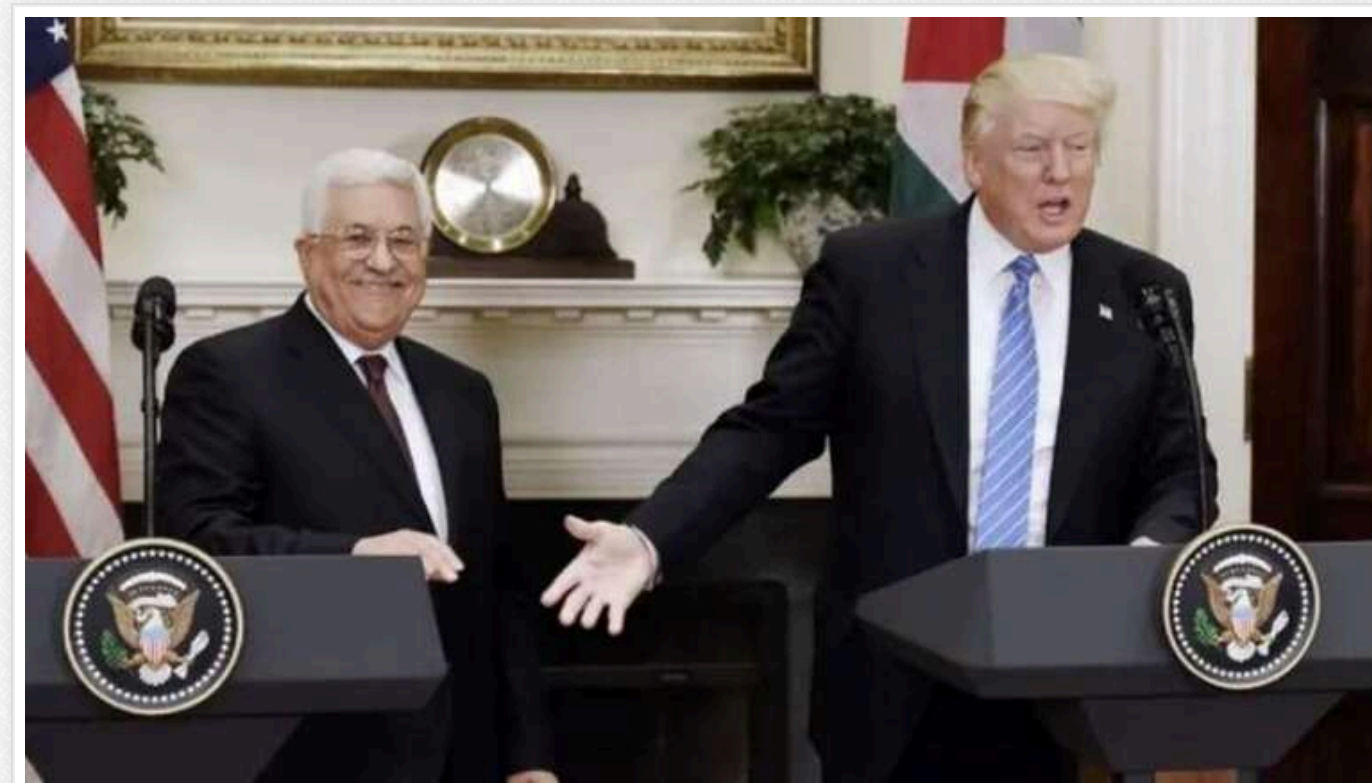
Дональд Трамп уперше за 7 років провів розмову з лідером Палестини

Обраний президент США Дональд Трамп вперше з 2017 року провів телефонну розмову з лідером Палестини Махмудом Аббасом. Політики не спілкувалися з того часу, як Трамп визнав Єрусалим столицею Ізраїлю та перемістив туди американське посольство.