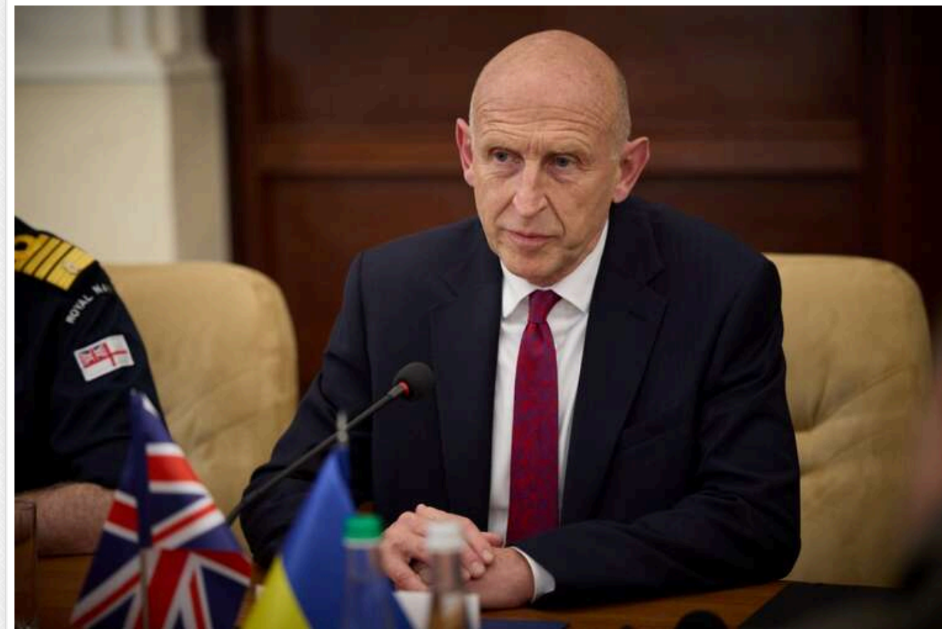
Росія у жовтні зазнала рекордних втрат з початку війни, - британський міністр

У жовтні російські втрати на фронті були найбільшими з початку повномасштабної війни. Щоденно окупанти втрачали в середньому 1354 солдатів.