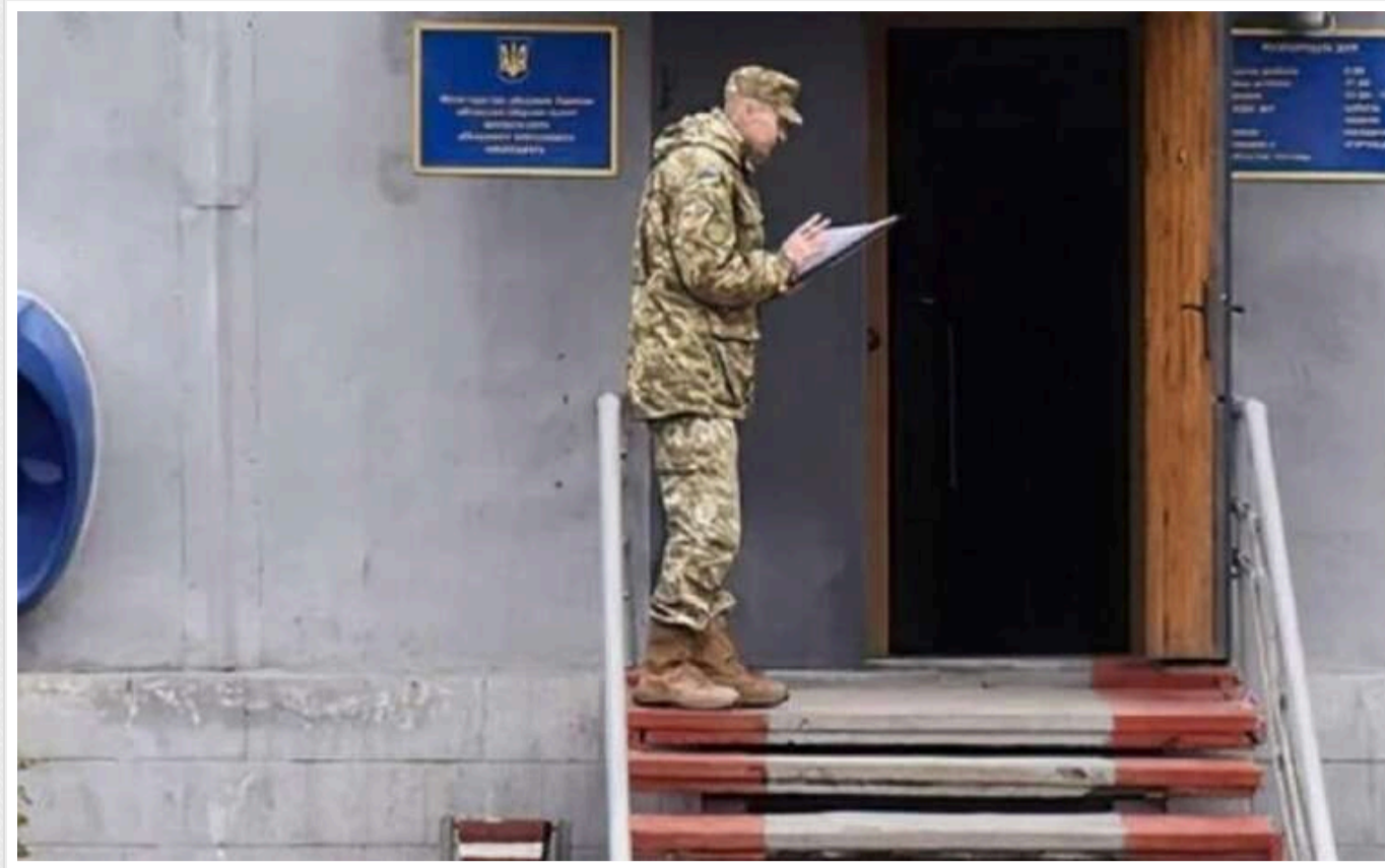
Верховинський ТЦК викрав киянина і примусово тримає у підвалі без їжі та води