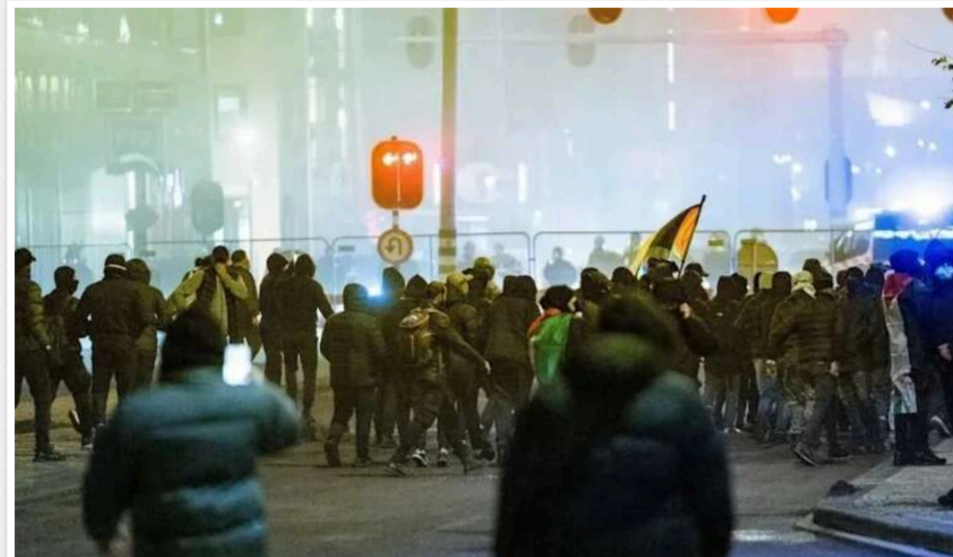
Ізраїль міг застерегти Нідерланди про потенційний напад в Амстердамі, - ЗМІ

Уряд Нідерландів досліджує, чи були пропущені можливі попереджувальні ознаки з боку Ізраїлю у ході подій, що призвели до нападів на ізраїльських футбольних уболівальників цього тижня.