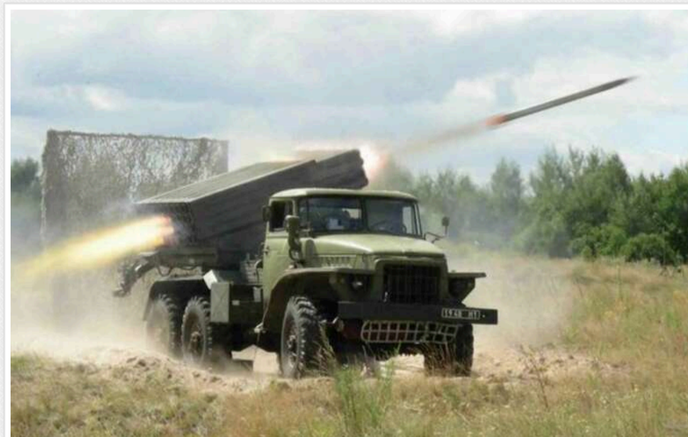
Військові СБУ за два тижні знищили 16 російських "Градів"

Протягом двох тижнів українські спецпризначенці знищили 16 російських "Градів". Ворожу техніку було атаковано дронами.