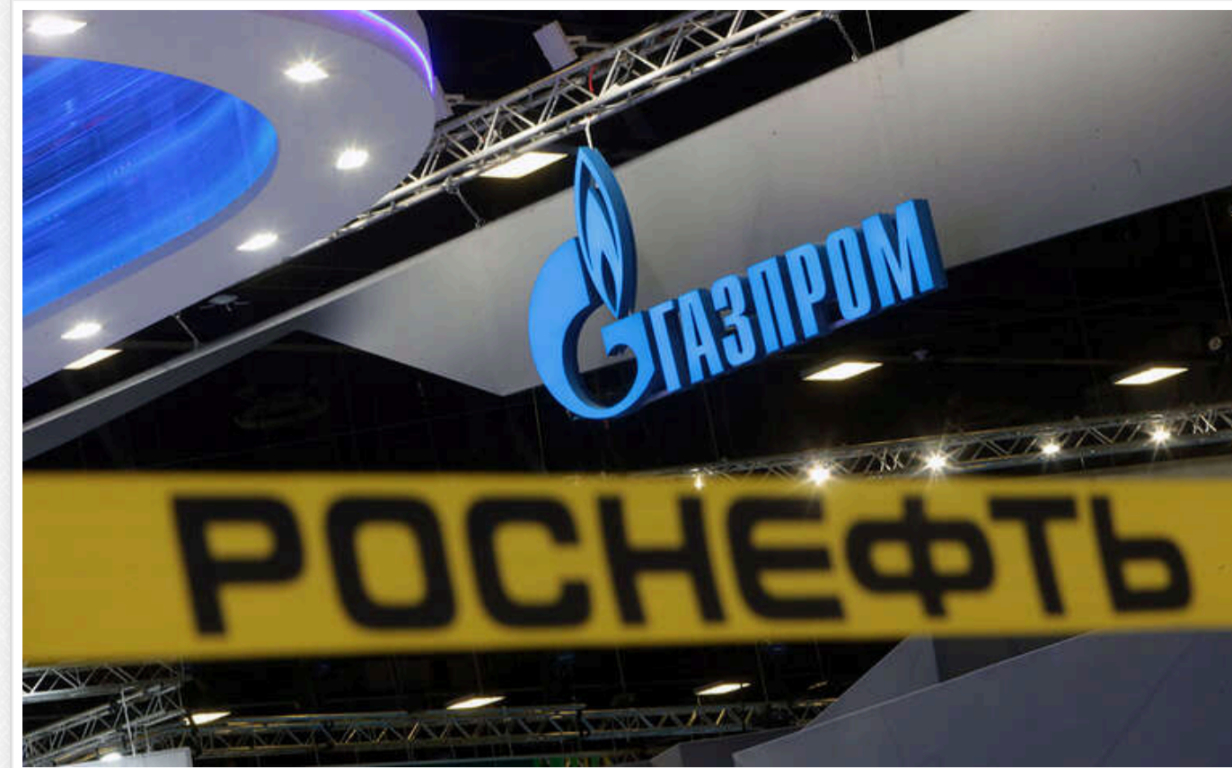
Росія обмірковує можливість об'єднання трьох найбільших нафтових компаній країни в одну мегакорпорацію, - WSJ

Як повідомляє The Wall Street Journal, джерела, знайомі з ходом обговорень, поділилися цією інформацією.