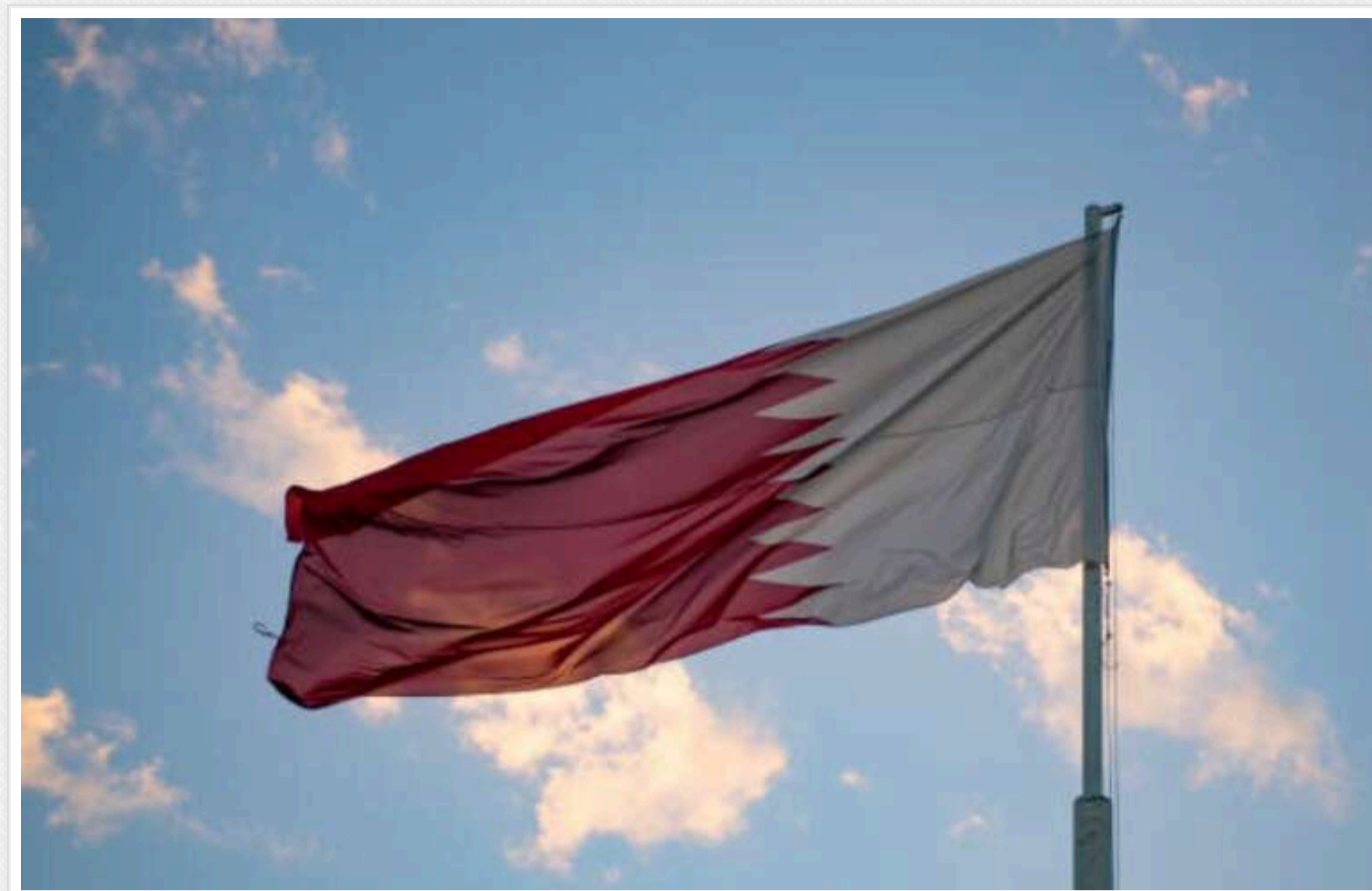
Катарська влада депортувала з країни членів ХАМАС, - ЗМІ

Times of Israel і Financial Times повідомляють про це, посилаючись на свої джерела.