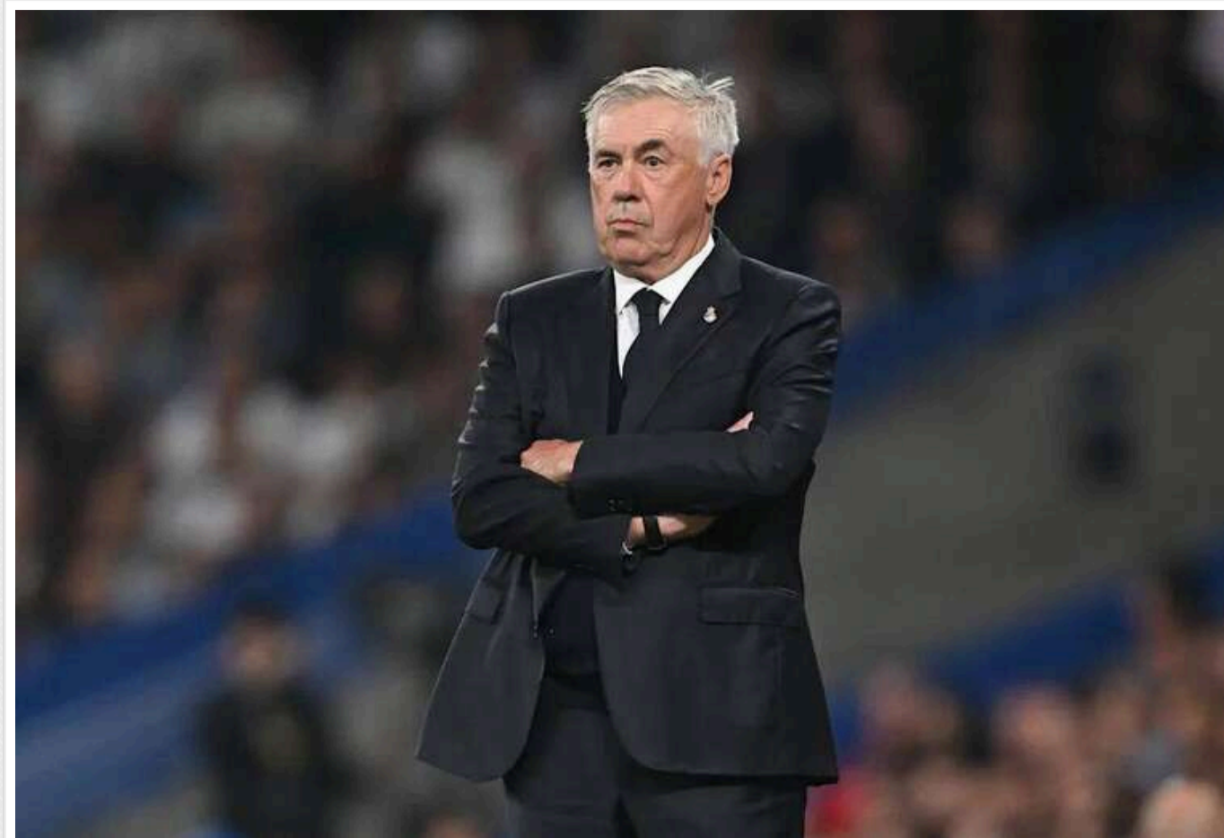
Тренер мадридського «Реалу» Карло Анчелотті піде з команди наступного року

Після болісної поразки від «Барселони» з рахунком 0:4 в Ель-Класіко та поразки від «Мілана» з рахунком 1:3 в Лізі чемпіонів головний тренер мадридського «Реалу» Карло Анчелотті опинився під шквалом жорсткої критики.