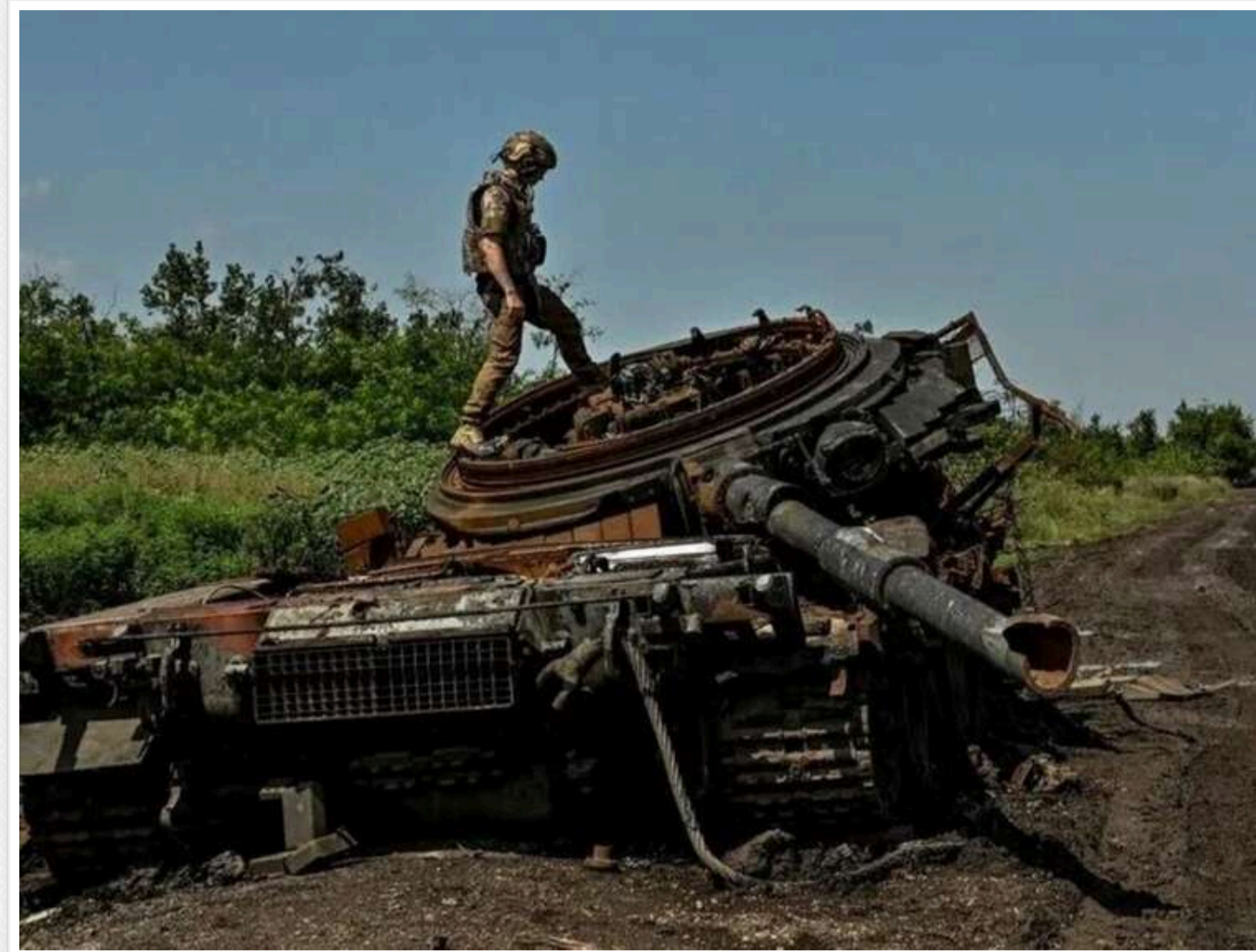
Втрати ворога за добу: Сили оборони відмінували 1660 російських окупантів та 5 танків

Українські воїни напередодні, 8 листопада, "денацифікували" близько 1660 російських окупантів за добу. Також вони знищили 184 одиниці ворожої техніки та озброєнь.