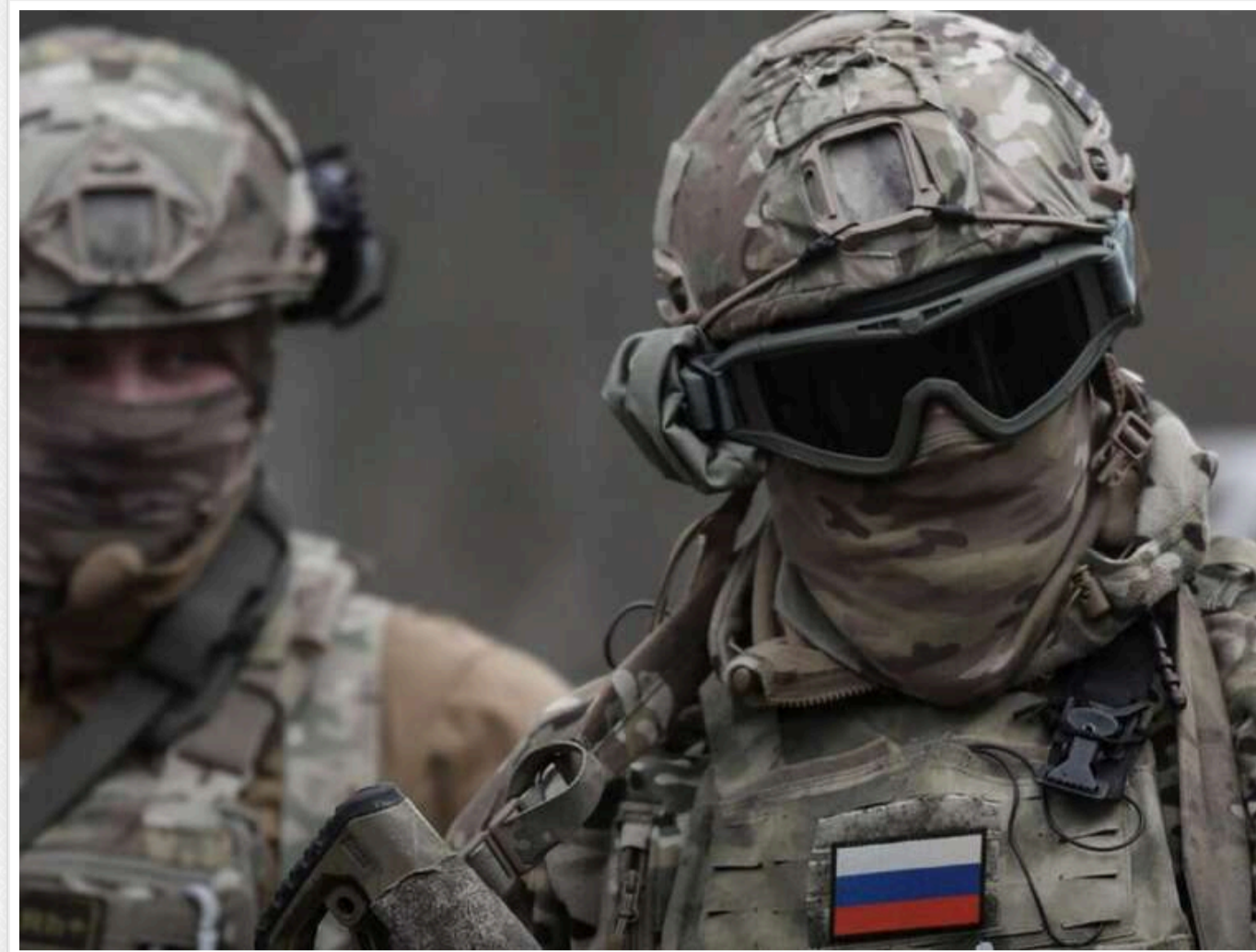
Окупанти хочуть взяти ЗСУ в оточення на південному сході від Курахового, - DeepState

Російські Збройні сили намагаються скоротити «кишеню» на південному сході від Курахового.