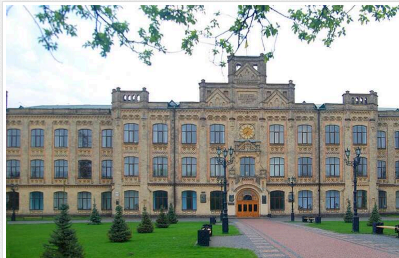
У КПІ заборонили використання Telegram

Як відомо, столичні університети відмовилися від використання Telegram у робочих цілях. Тепер і в Національному технічному університеті "Київський політехнічний інститут імені Ігоря Сікорського" запровадили заборону на використання месенджера "Telegram".