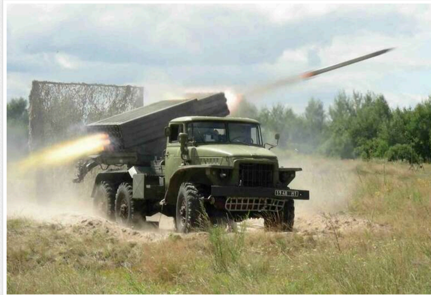
Загарбники вночі завдали ударів по Дніпропетровщині: є постраждалих, пошкоджено підприємство

У ніч на 9 листопада російські війська завдали удару з "градів" по Нікополю на Дніпропетровщині. Пошкоджено промислове підприємство.