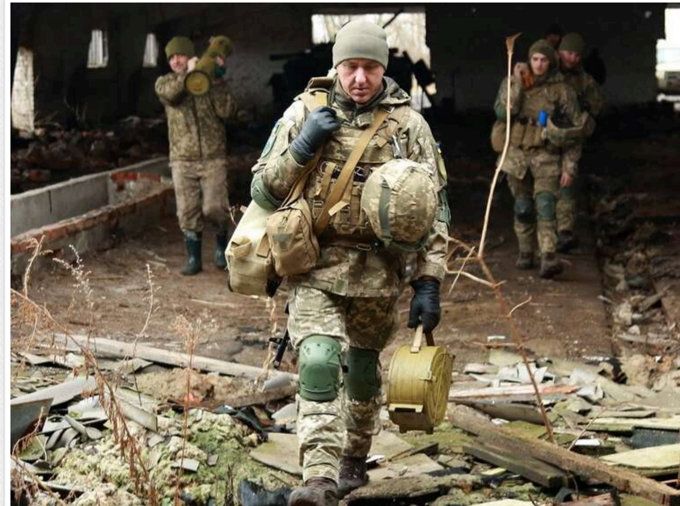
Ситуація на фронті: Ворог зазнав великих втрат на Покровському напрямку

На фронті України з початку доби 8 листопада сталося вже 164 бойових сутички. Напрямок Покровське залишається одним з найгарячіших, і тут за день ліквідовано 290 російських загарбників.