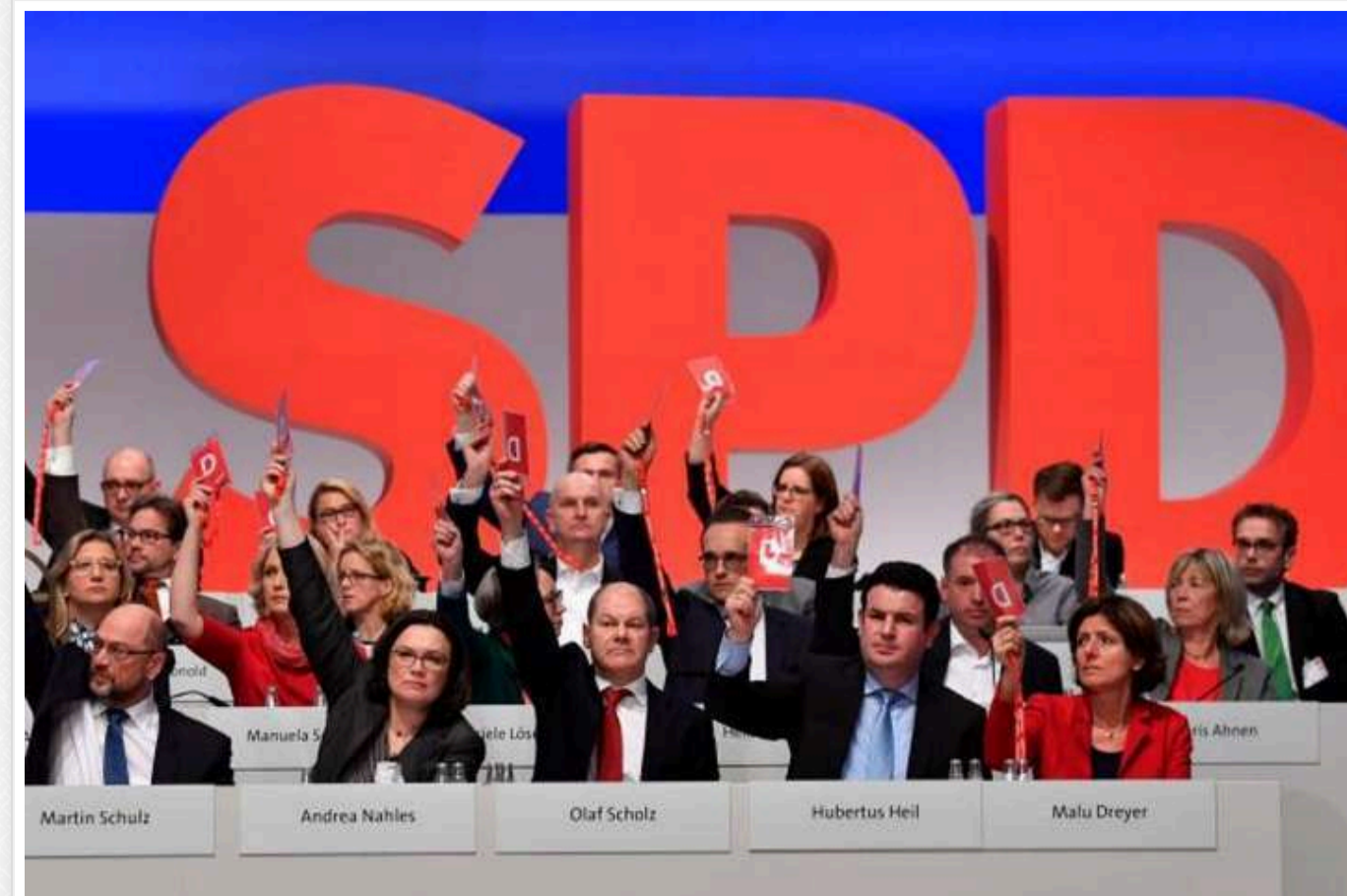
У Німеччині партія Шольца планує залишити його кандидатом у канцлери на майбутніх виборах

Соціал-демократична партія Німеччини планує залишити чинного канцлера Олафа Шольца своїм кандидатом у канцлери на майбутніх виборах.