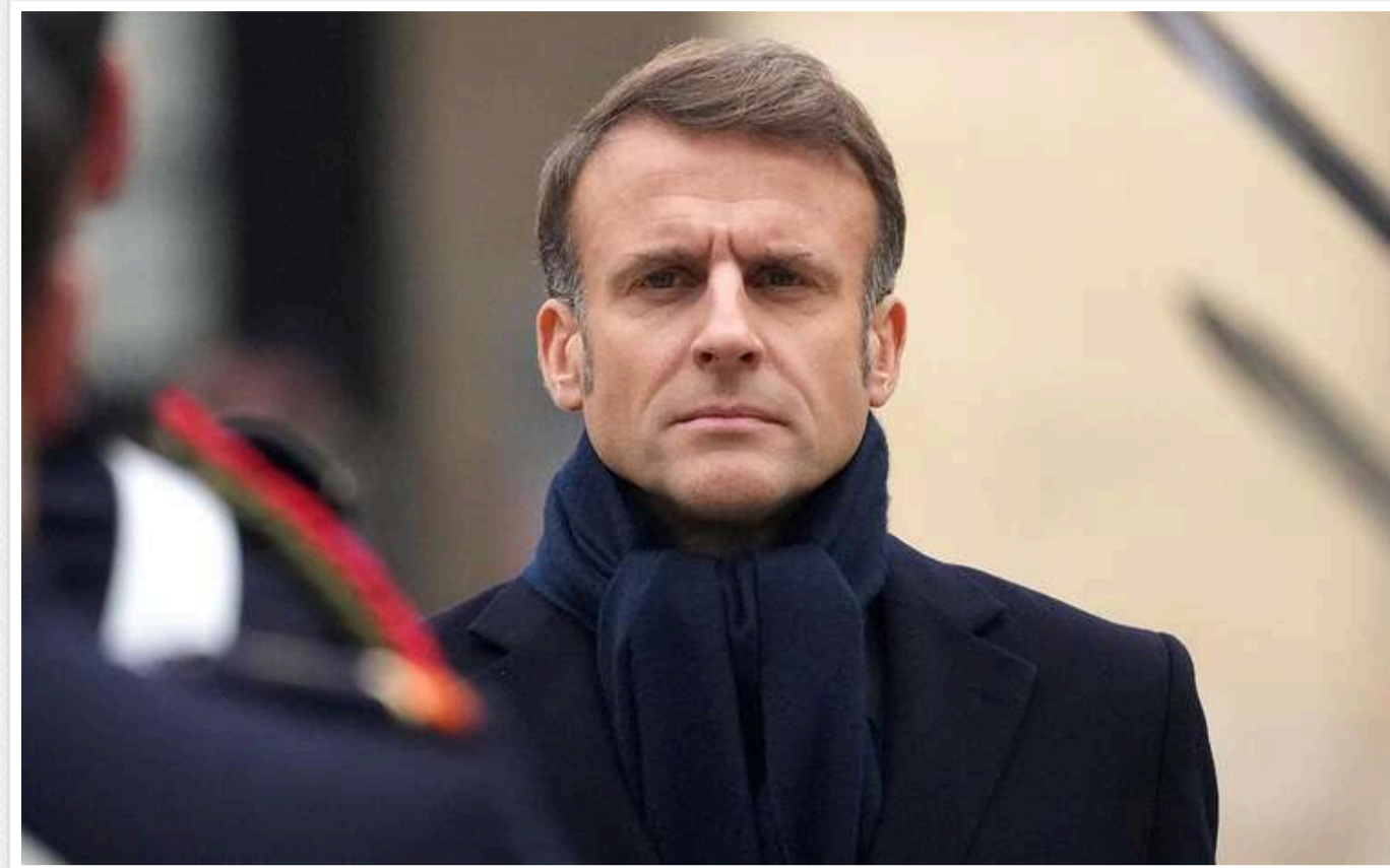
Євросоюз повинен захищати свої інтереси, а не делегувати безпеку США, - Макрон

Французький лідер Емманюель Макрон вважає, що європейці не повинні покладати свою безпеку на США, а повинні активніше захищати свої інтереси.