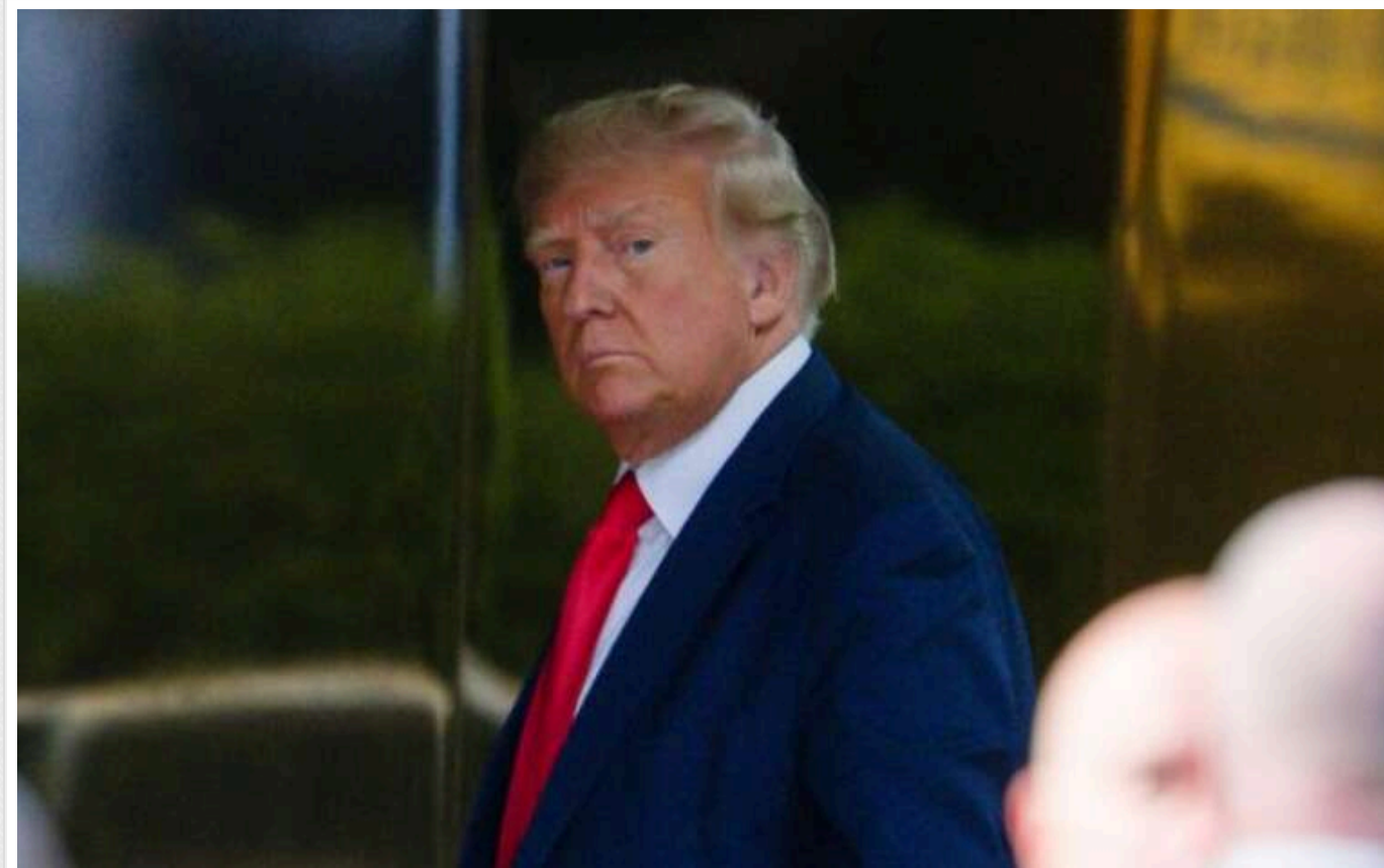
ЗМІ з'ясували, хто може стати членами ради національної безпеки Трампа

Після перемоги на виборах у США Дональд Трамп має намір залучити знайомих до своєї команди з питань національної безпеки. Відомо, що республіканець не збирається залишати колишніх генералів.