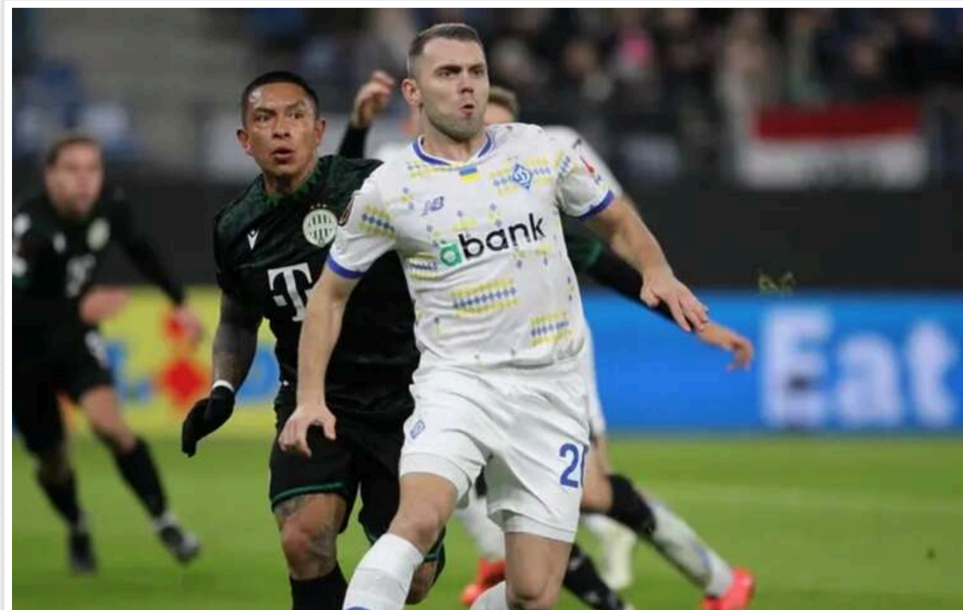
ФК "Динамо" зазнала розгромної поразки від угорців у Лізі Європи, граючи у меншості