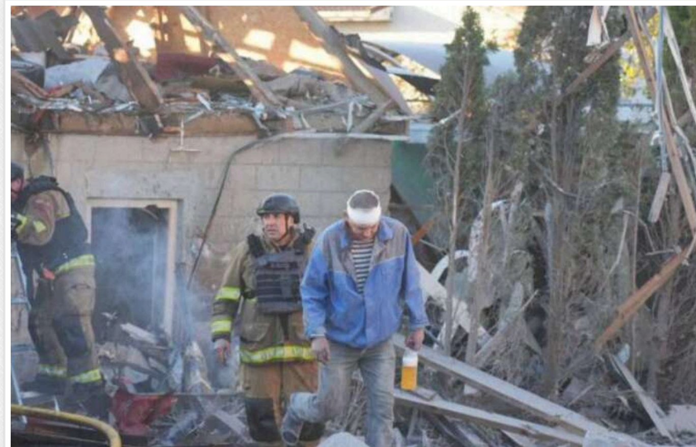
Обстріл Запоріжжя керованими авіаційними бомбами: кількість загиблих та поранених збільшилася

У Запоріжжі збільшилася кількість жертв та поранених після атаки авіабомбами 7 листопада. Вісім осіб загинули, серед яких – одnorічна дитина.