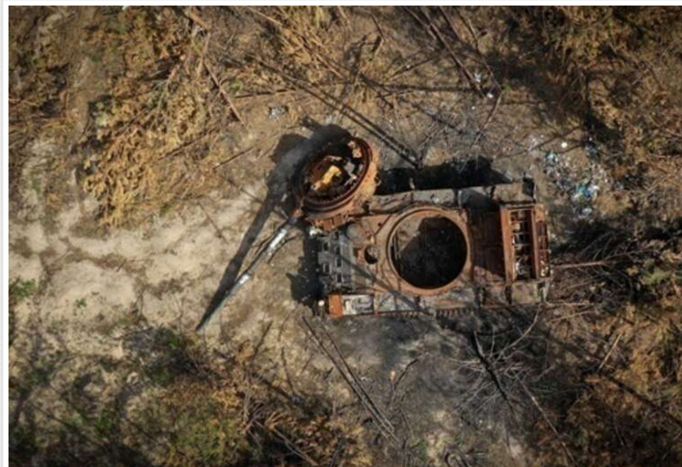
Генштаб оновив втрати РФ за добу: мінус 1600 окупантів та майже 120 дронів

Станом на 8 листопада втрати російських військ склали 1580 військовослужбовців. Крім того, ЗСУ збили 118 дронів та знищили 49 БМ.