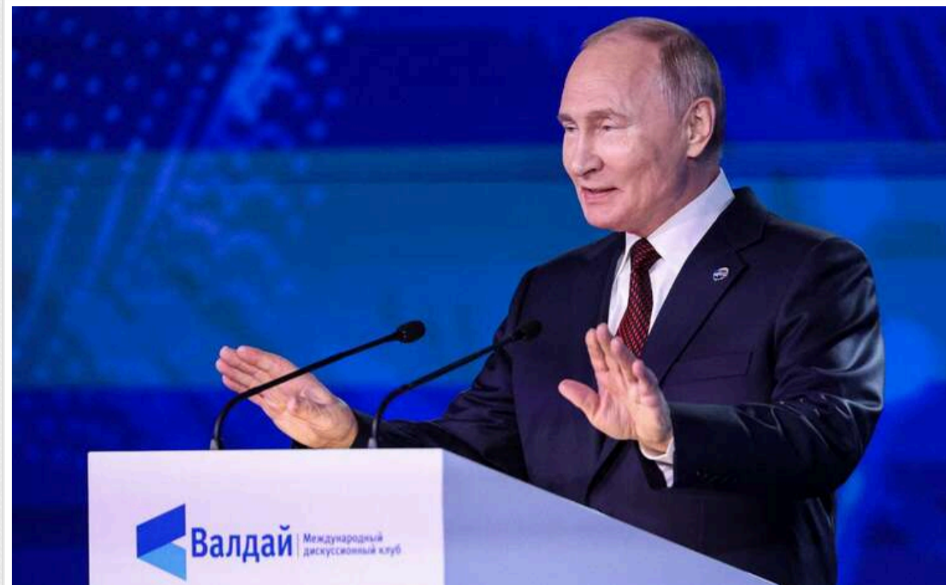
Путін удесяте за цей рік висловив невдоволення з приводу обману з боку Заходу

Російський диктатор Путін на пленарному засіданні «Валдай» знову підкреслив, що країни Заходу «обманули» Росію при підписанні Мінських угод.