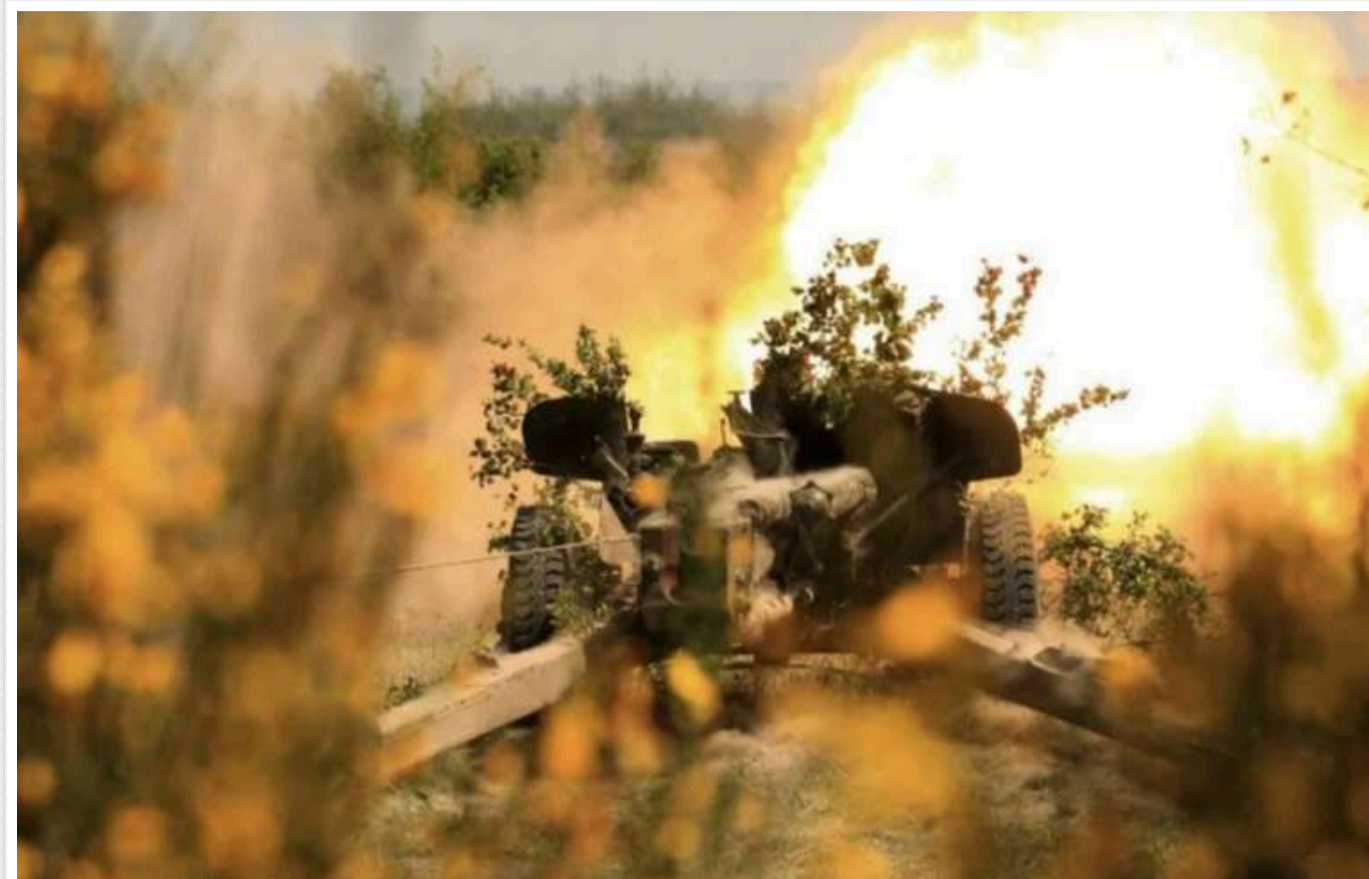
ЗМІ: Прихід Трампа може ознаменувати початок кінця війни в Україні

Обрання Дональда Трампа президентом США може стати початком завершення війни в Україні, але, ймовірно, на умовах, які дозволять Володимиру Путіну зберегти контроль над більшою частиною захоплених територій.