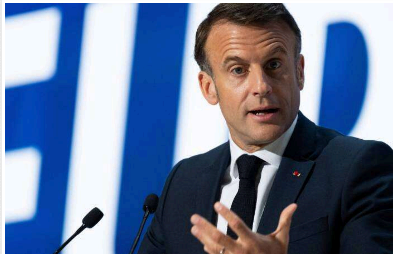
Європа більше не може бути «травоїдною» після переобрання Трампа на пост президента США, - Макрон

Таку думку висловив президент Франції Емманюель Макрон, як повідомляє видання Politico.