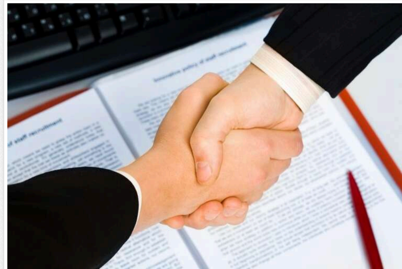
Близько 8 мільйонів українців наразі в Україні не працевлаштовані та не займаються пошуком роботи