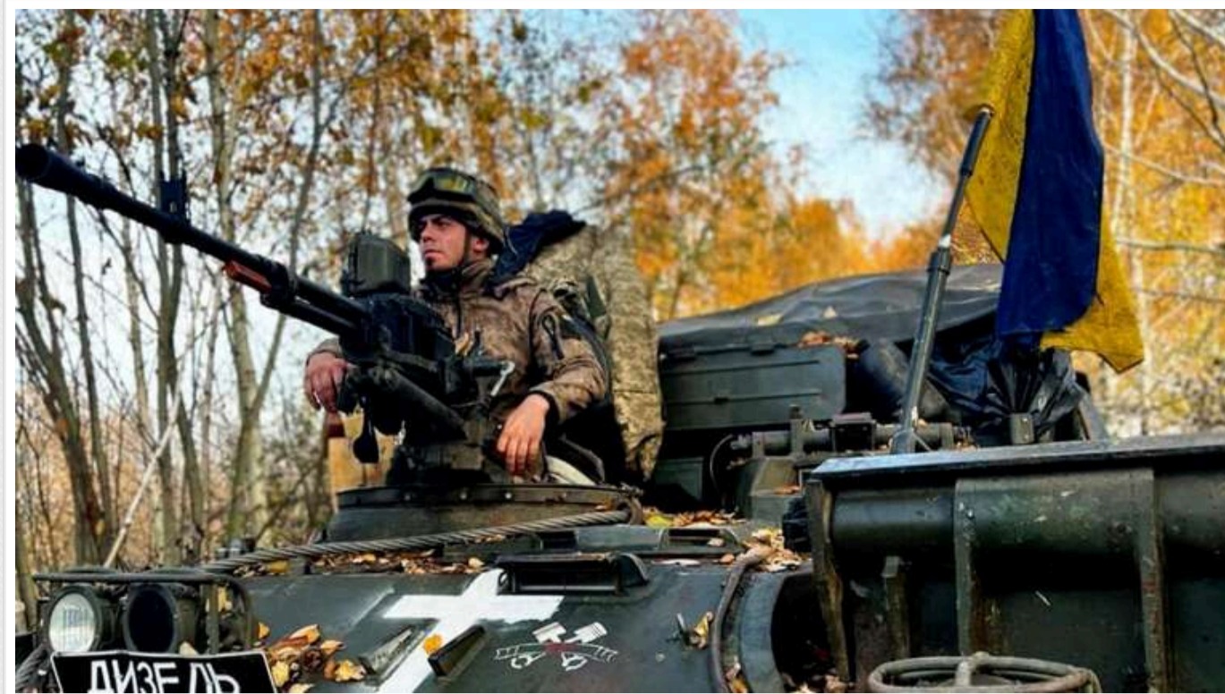
Ситуація на фронті: за минулу добу відбулось 140 боїв

Ситуація на Курахівському напрямку залишається напруженою - ворог зосереджує там основні наступальні зусилля.