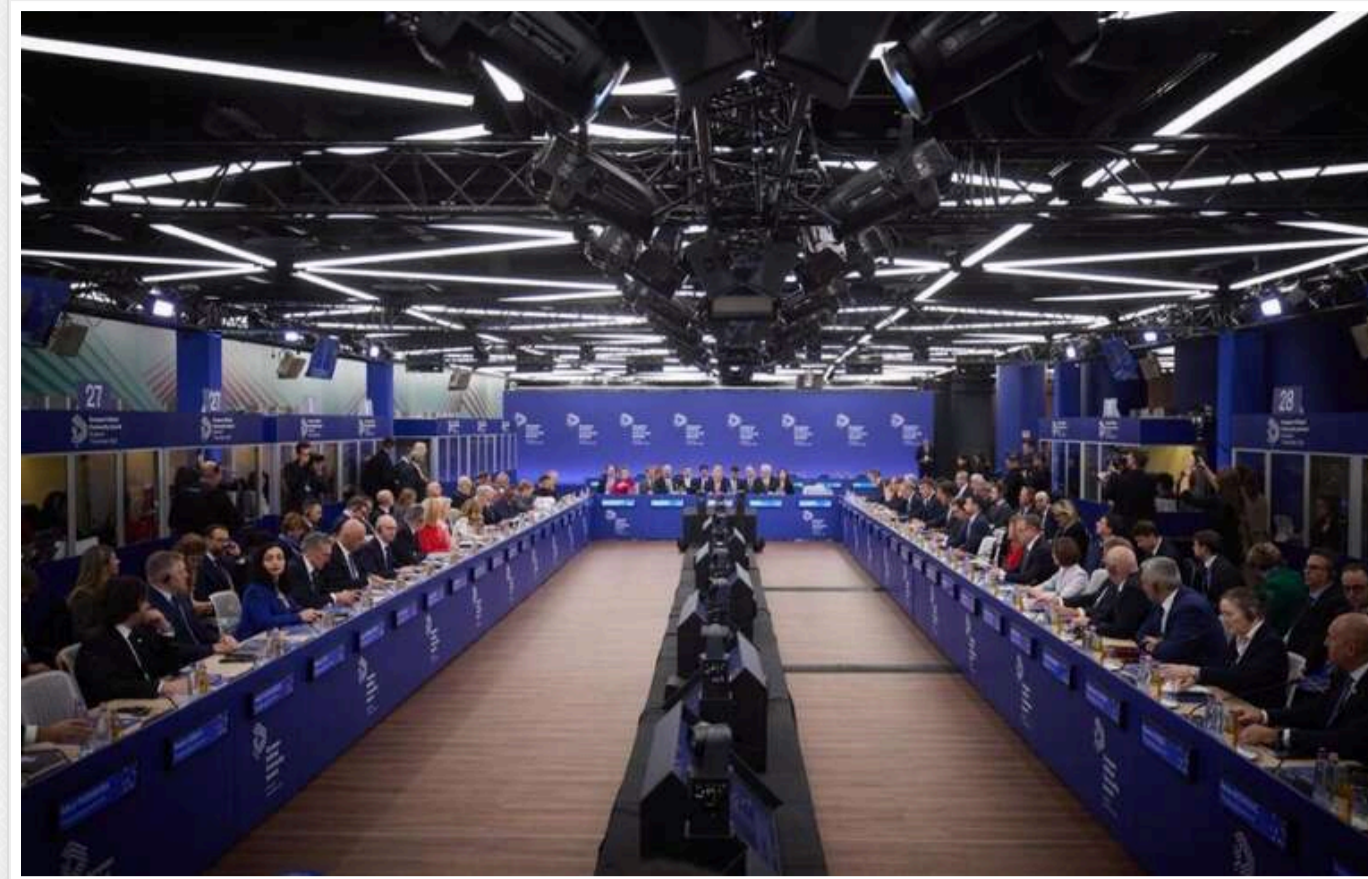
У Будапешті на саміті деякі лідери ЄС обговорювали питання поступок із боку України

Як повідомляє Bloomberg, про це заявив український президент Зеленський, виступаючи на неформальній зустрічі Європейського Союзу в Будапешті.