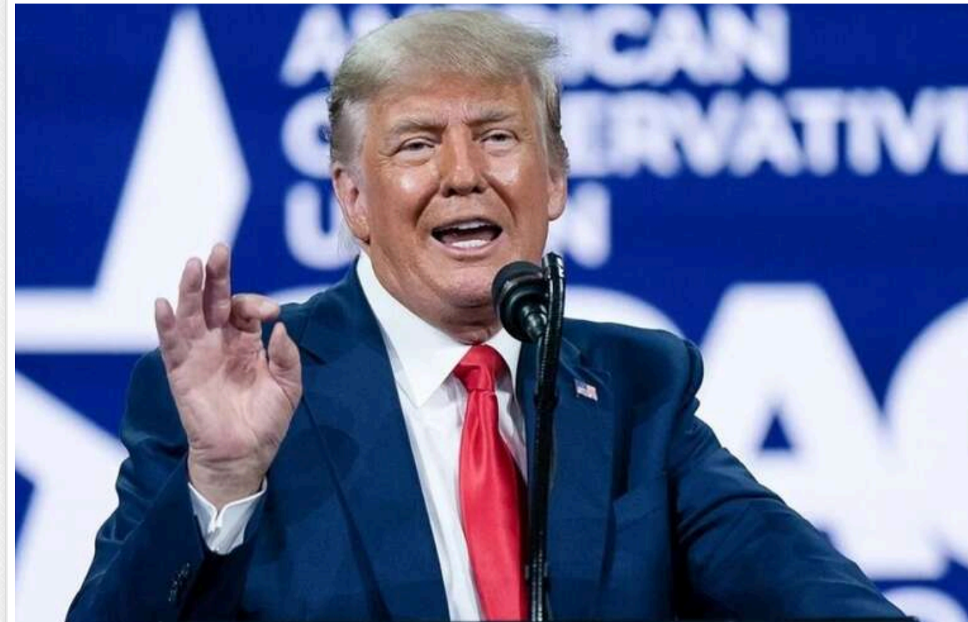
Як після обрання Дональд Трамп може змінити сферу технологій

Експерти вважають, що Дональд Трамп може запровадити значні мита на експорт чіпів з Китаю та частково продовжити політику Джо Байдена щодо ШІ.