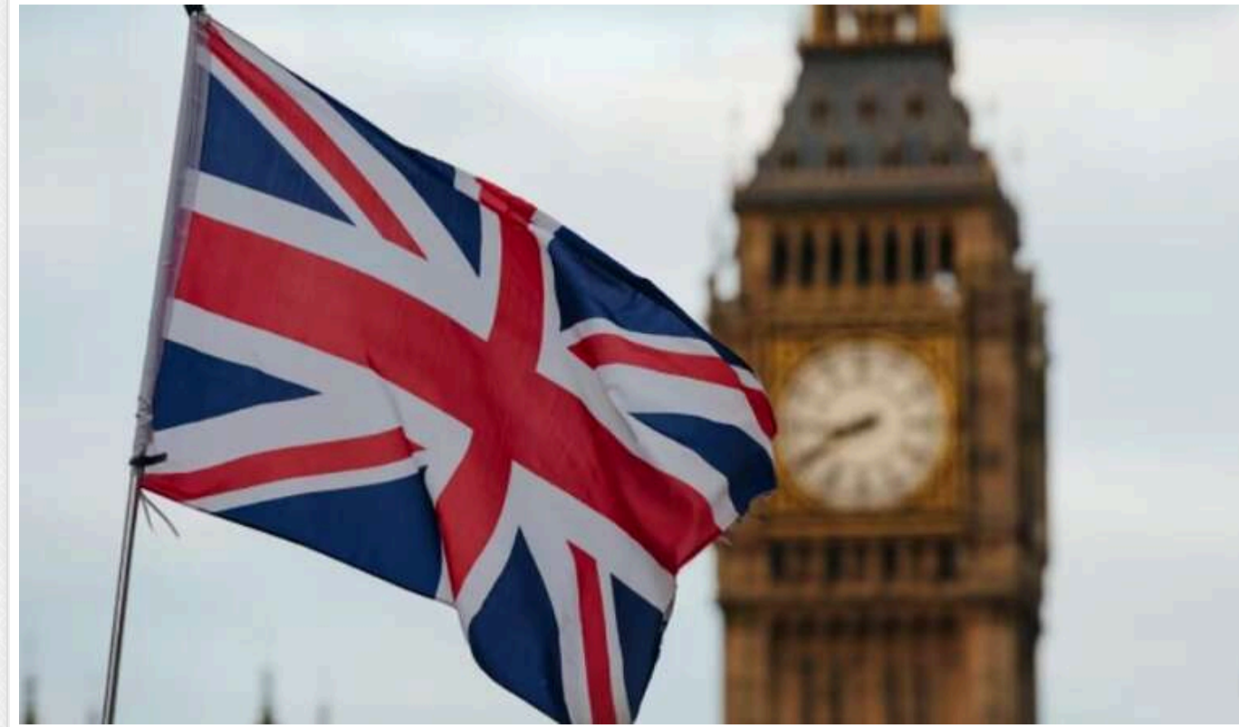
Британія запровадила великі санкції проти російського ВПК і найманців, яких підтримує РФ

У четвер Британія оголосила у своєму найбільшому пакеті антиросійських заходів з травня 2023 року про введення нових санкцій проти російського військово-промислового комплексу та підтримуваних Росією груп найманців.