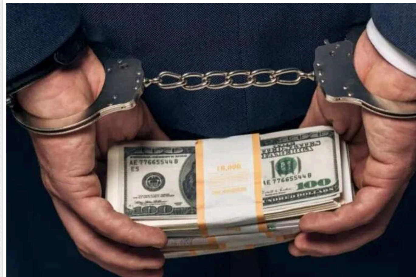
Як VIP-корупціонери ховаються в армії від правосуддя

29 жовтня 2024 року Вищий антикорупційний суд (ВАКС) нарешті ухвалив вирок у справі щодо завдання АТ "Укрзалізниця" збитків на 92 млн грн через закупівлю дизельного пального за завищеними цінами. Ця історія тягнулася ще з 2017 року.