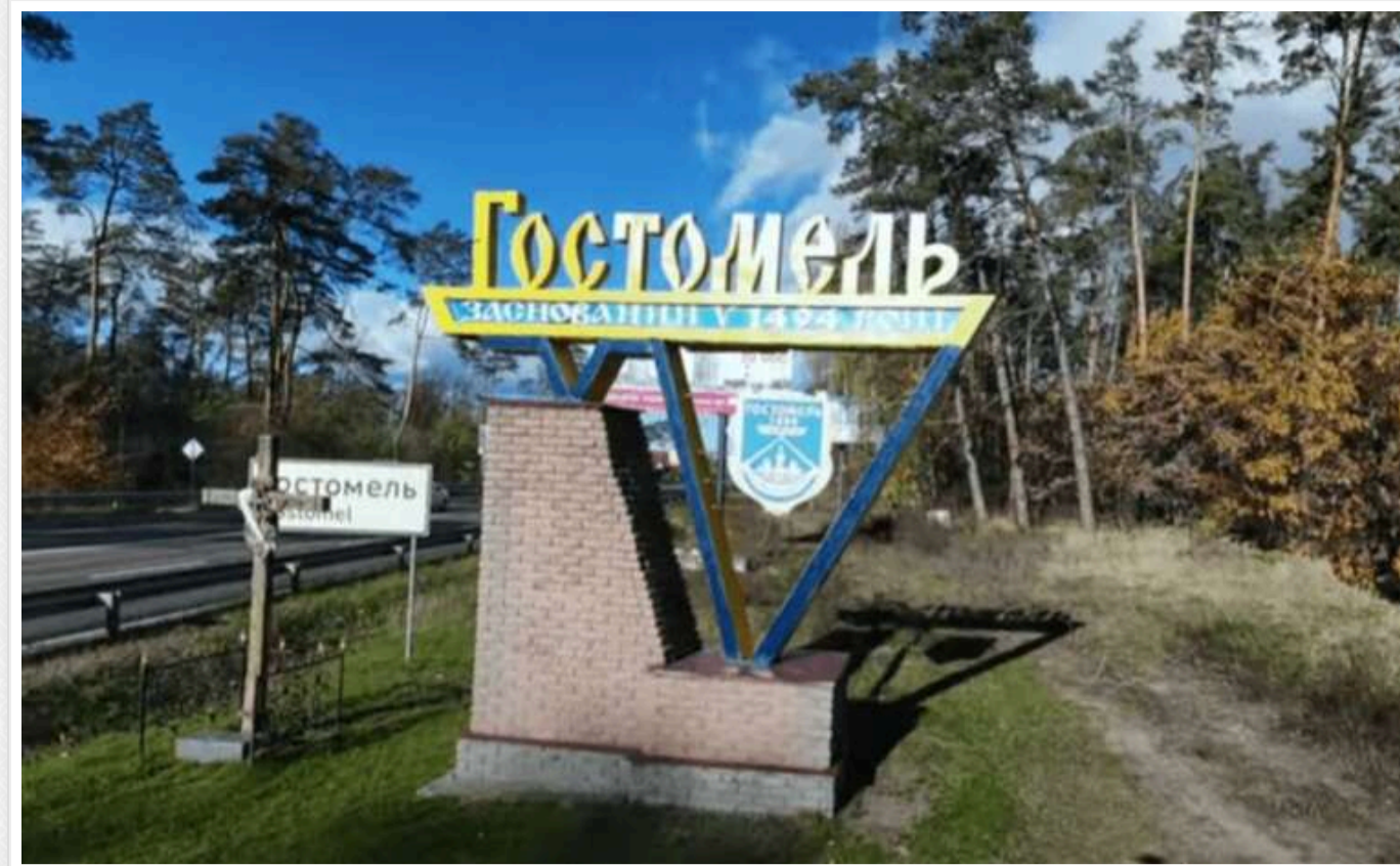
У Гостомелі ВЦА знову пиляє бюджетні кошти, які спрямовувалися на відбудову знищеного окупантами житла