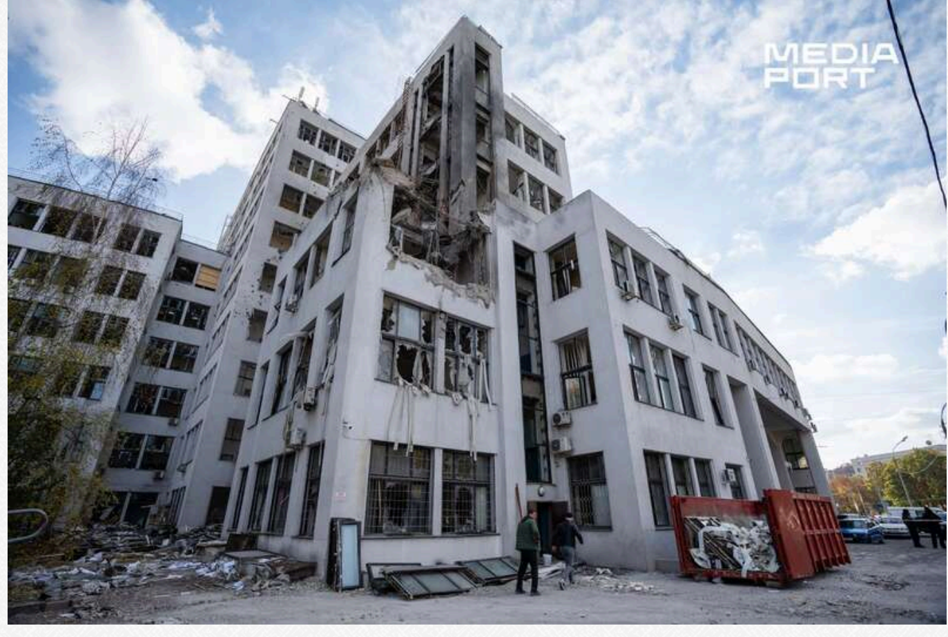
Російська авіабомба 28 жовтня влучила у Держпром з боку проспекту Незалежності. Фото від 29 жовтня

Дерев'яні вікна повторити можна, якщо працюють чи будуть працювати фірми, які на це здатні. Коли виконувалися реставраційні роботи, одна і та сама фірма повністю виконувала всі дерев'яні вікна по всій будівлі і металеві вітражі на сходах.