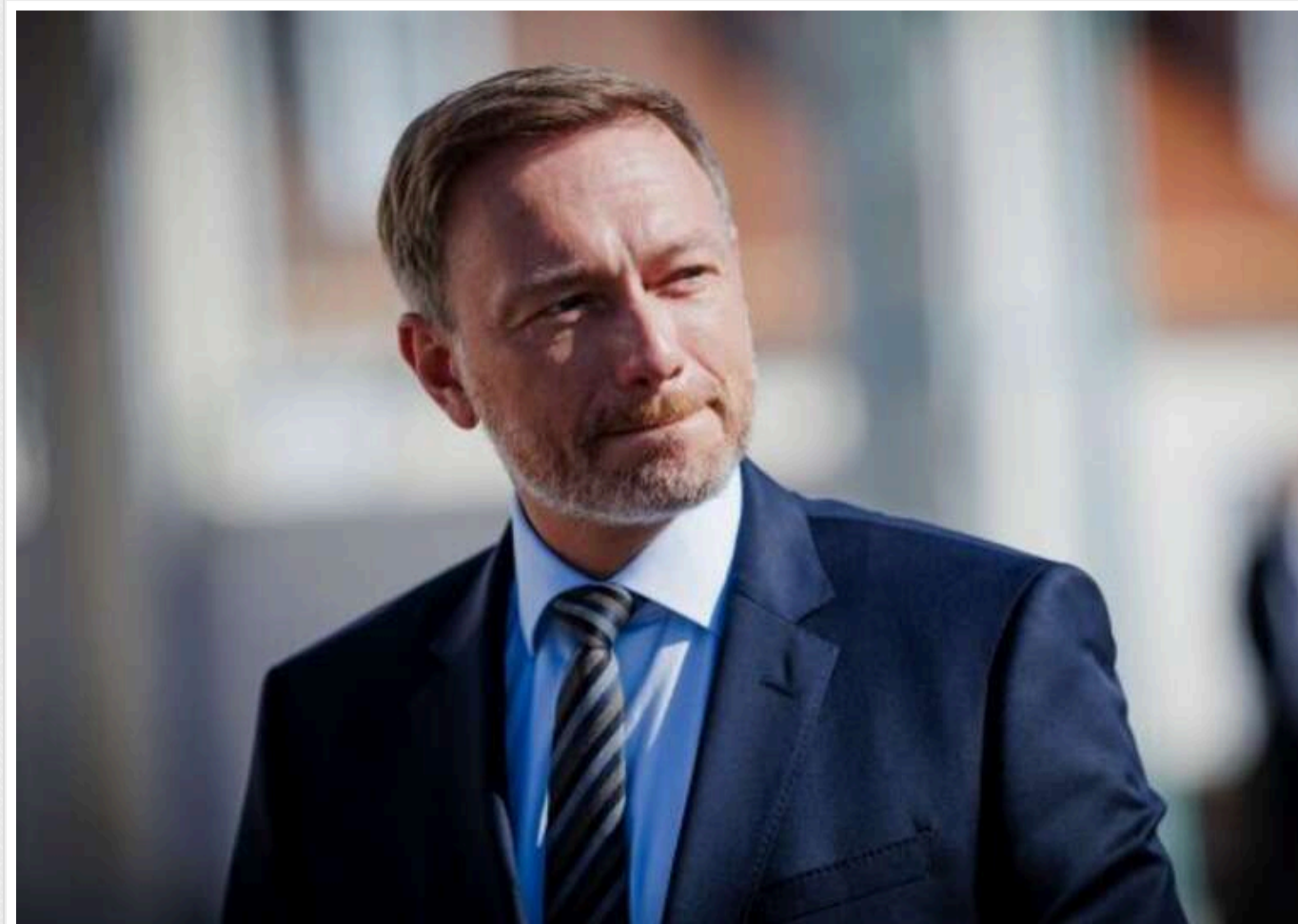
Лінднер хотів дати Україні ракети Taugus, але його звільнили, - ЗМІ

Звільнений міністр фінансів Німеччини Крістіан Лінднер звинуватив федерального канцлера Олафа Шольца. Він стверджує, що канцлер нібито перешкоджав "ефективній військовій підтримці України".