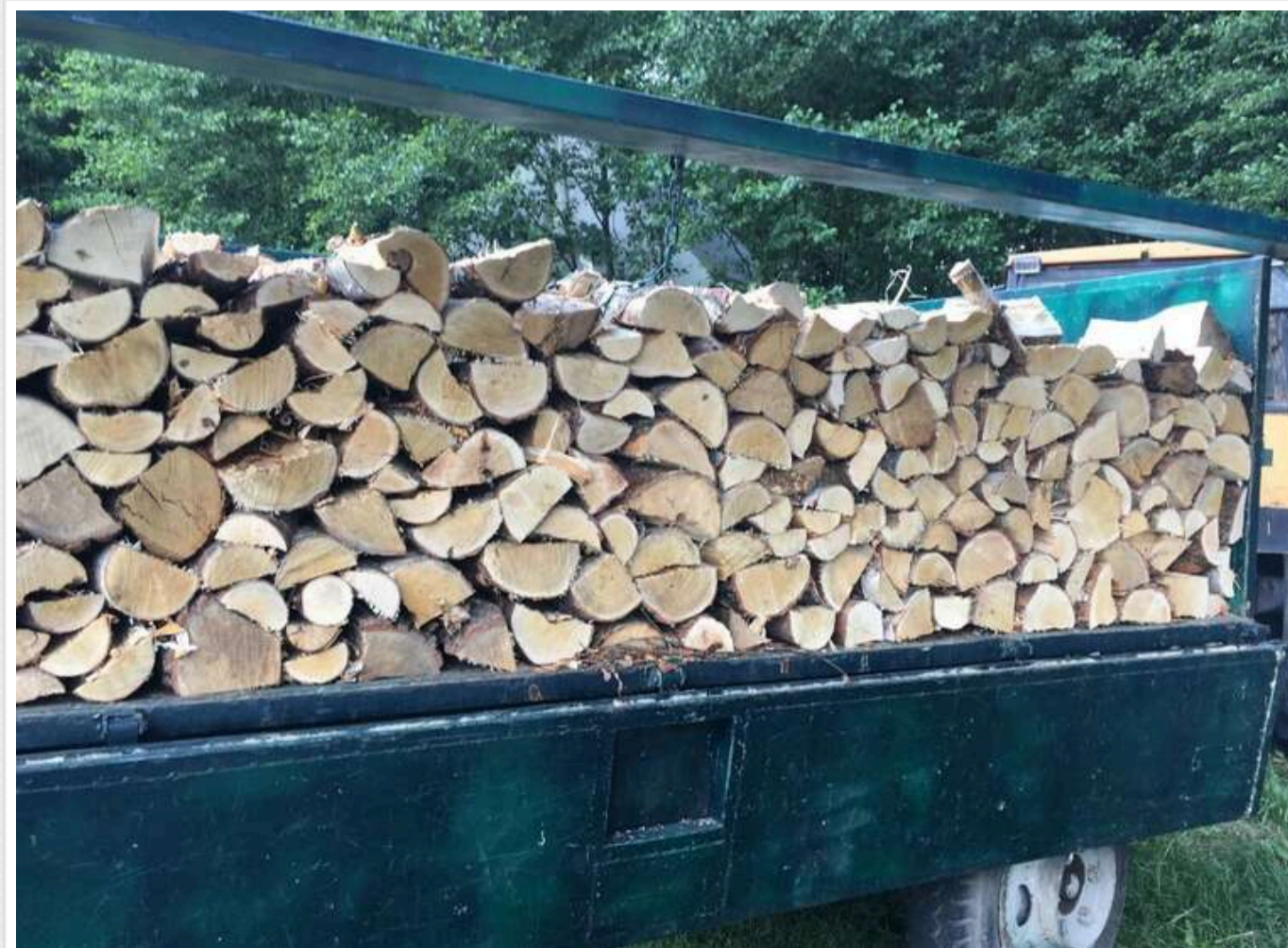
У Миколаєві оштрафували чоловіка через відсутність документів на дрова

Громадяни України отримують штрафи за відсутність документів про походження дров.