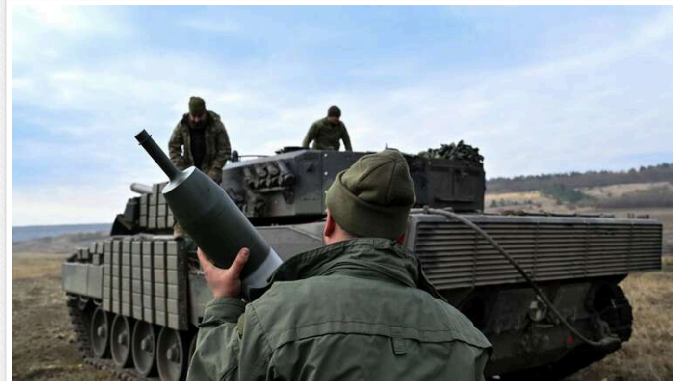
DeepState: Армія РФ продовжує обходити Курахове з півночі та півдня, прагнучи вийти в тил ЗСУ

Згідно з картою DeepState, за останню добу росіяни просунулися північніше Курахового на ділянці між Вишневим і Вознесенкою.