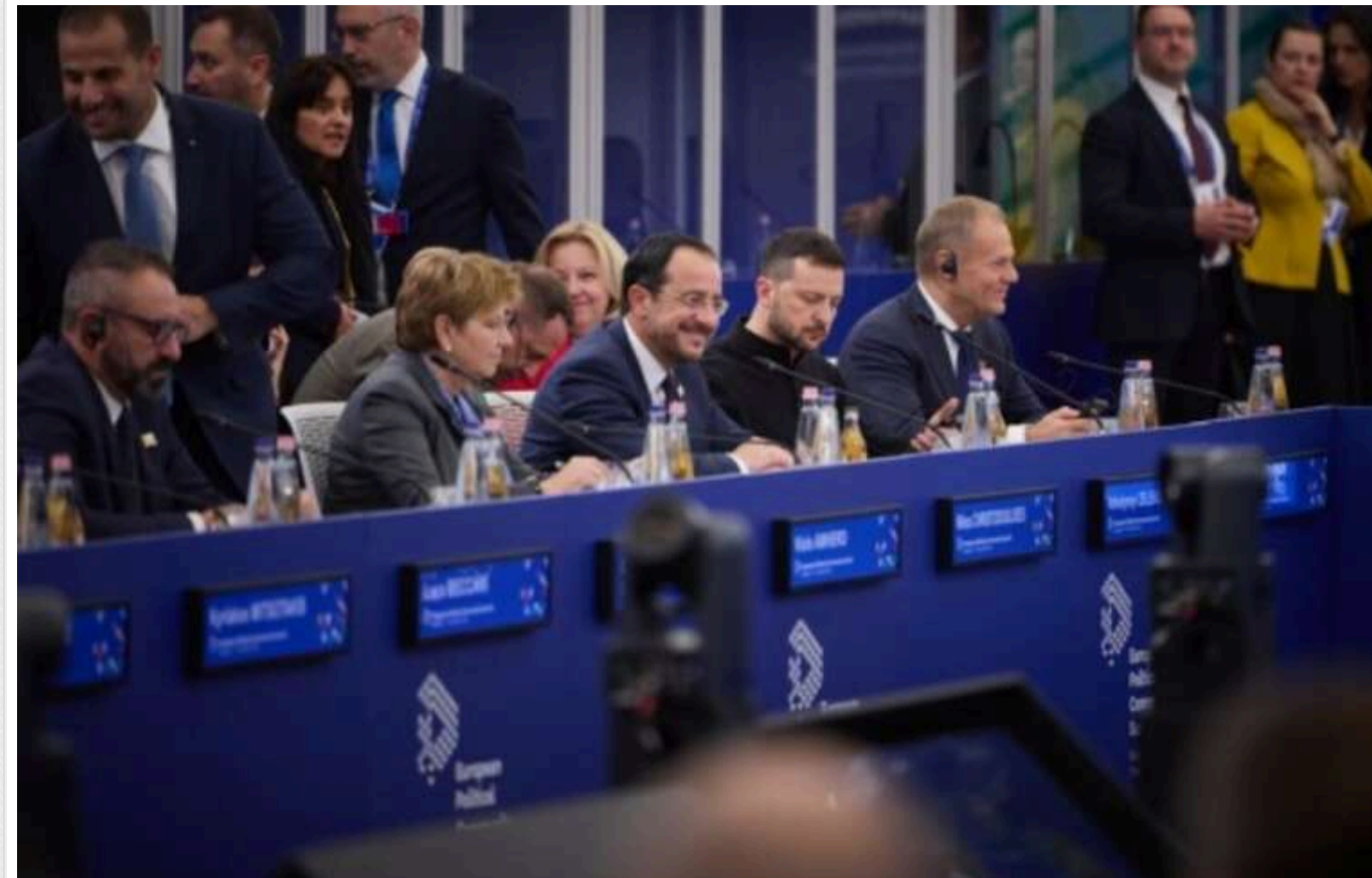
Зеленський: Поступки Путіну є неприйнятними для України та самогубством для всієї Європи

Президент Володимир Зеленський наголосив, що Україні потрібна достатня кількість зброї, а не підтримка у переговорах із РФ.