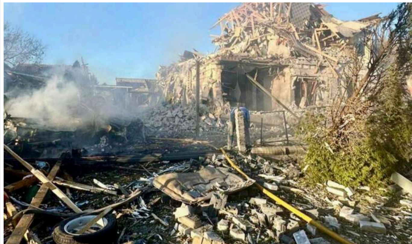
Окупанти здійснили масований удар КАБами по Запоріжжю: є приліт по лікарні

У Запоріжжі зафіксовані влучання по житлових будинках та лікарнях.