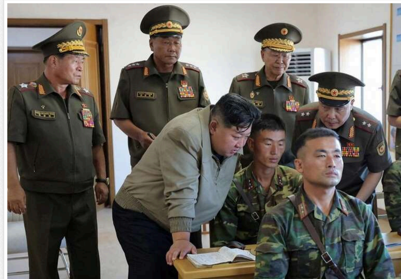
Bild: Російським солдатам почали видавати тушонку з собак, спочатку призначену для північнокорейської армії

За повідомленнями журналістів, уряд Північної Кореї заохочує вживання в їжу собачого м'яса. Консерви були виготовлені зі спеціальної породи собак.