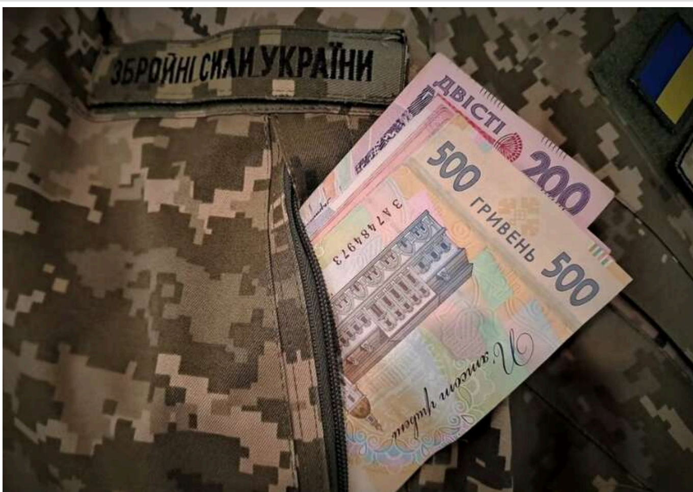
Адвокатка розповіла про механізм конфіскації майна корупціонерів на користь ЗСУ

«Практика передачі конфіскованого майна, отриманого корупційним шляхом, на користь ЗСУ в Україні тільки починається. Переважно це суми 5-100 тисяч, мільйони передавалися кілька разів».