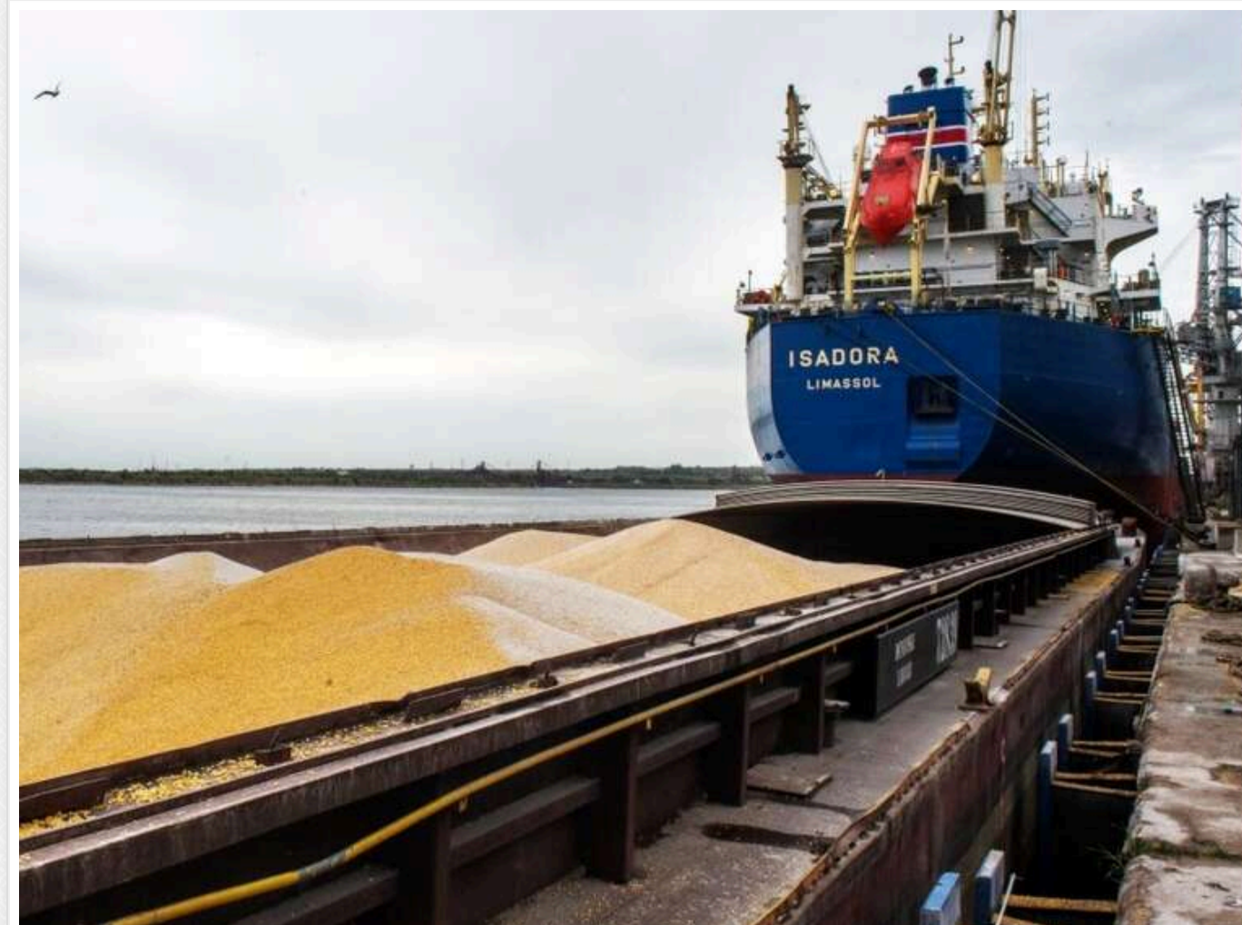
Зерновий «трикутник» Одеси: як митниця, податкова та БЕБ не помічають мільярдних схем

Одеська схема «відшкодування»: як компанії уникають податків під прикриттям БЕБ.