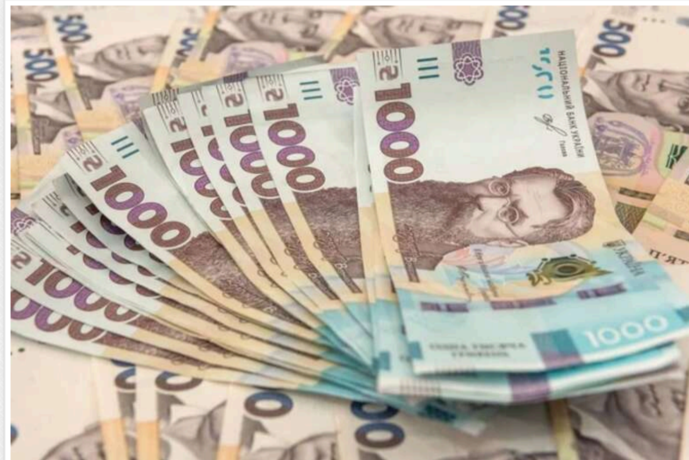
На спецпенсії для силовиків було витрачено близько 88 мільярдів гривень, - Мінсоцполітики

З початку 2024 року на спецпенсії для силовиків було витрачено близько 88 млрд грн, і до кінця року ця сума може збільшитися до 120 млрд грн, повідомили в Мінсоцполітики у відповіді на запит Forbes.