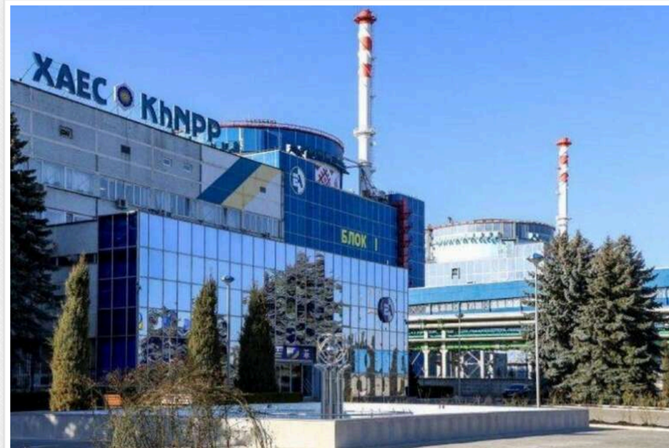
«Енергоатом» замовив ремонт покриття для підлог на ХАЕС: ціни майже вдвічі дорожчі за ринкові

Філія «ВП «Хмельницька АЕС» АТ «НАЕК «Енергоатом» 16 серпня за результатами тендеру замовила ТОВ «Апартменс Сільвер» ремонт виробничих приміщень цеху господарчого забезпечення вартістю 6,07 млн грн.