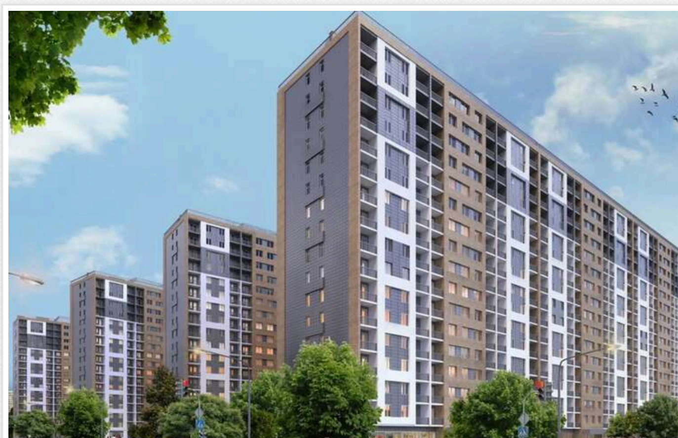
У Київській міськраді хочуть будувати нове житло на Солом'янці за 1 мільярд

Комунальне підприємство з утримання та експлуатації житлового фонду спеціального призначення «Спецжитлофонд» Київської міськради побудує житлові будинки на території виробничо-складської бази в Солом'янському районі по вул. Качалова, 40 загальною вартістю 1 млрд грн.