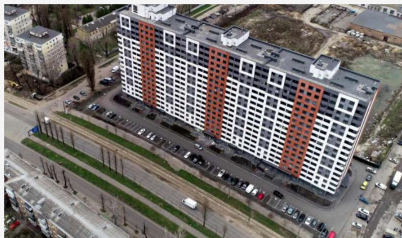
Фото станом на серпень 2023 року

Відповідно до розпорядження КМДА, шоста черга будівництва передбачалася для ветеранів АТО та людей, які потребують покращення житлових умов. Місто оплатить 30% вартості житла для громадян у черзі на квартиру та 50% для учасників АТО.