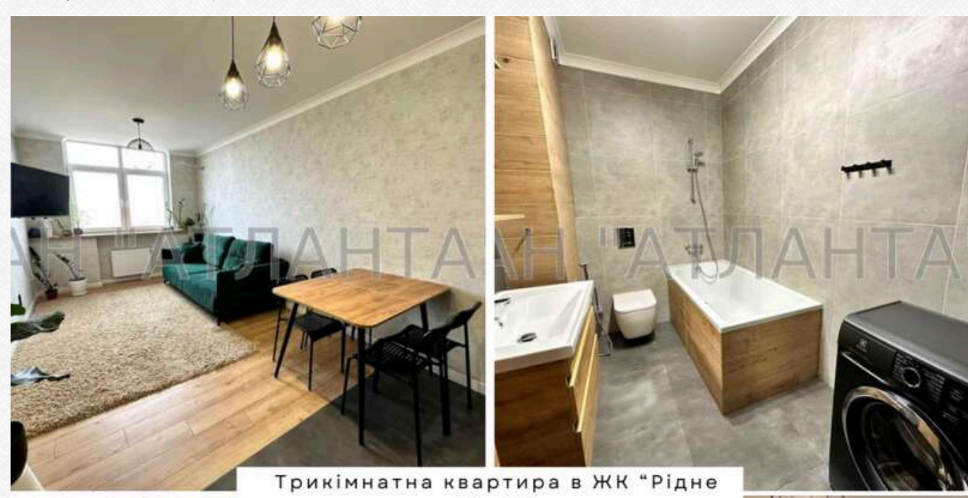
Трикімнатна квартира в ЖК "Рідне місто"

Металопластикові двокамерні вікна замовили по 8 029 грн/кв. м. Найдорожчий варіант енергоефективного двокамерного вікна Aluplast Ideal 4000 70 в «Епіцентрі» коштує 5 004 грн/кв. м, що на 38% дешевше. Калькулятор вікон на сайті okna.ua порекомендував, що двокамерне вікно Rehau Geneo в магазині Welarum буде коштувати 5 250 грн/кв. м, що на 35% дешевше.