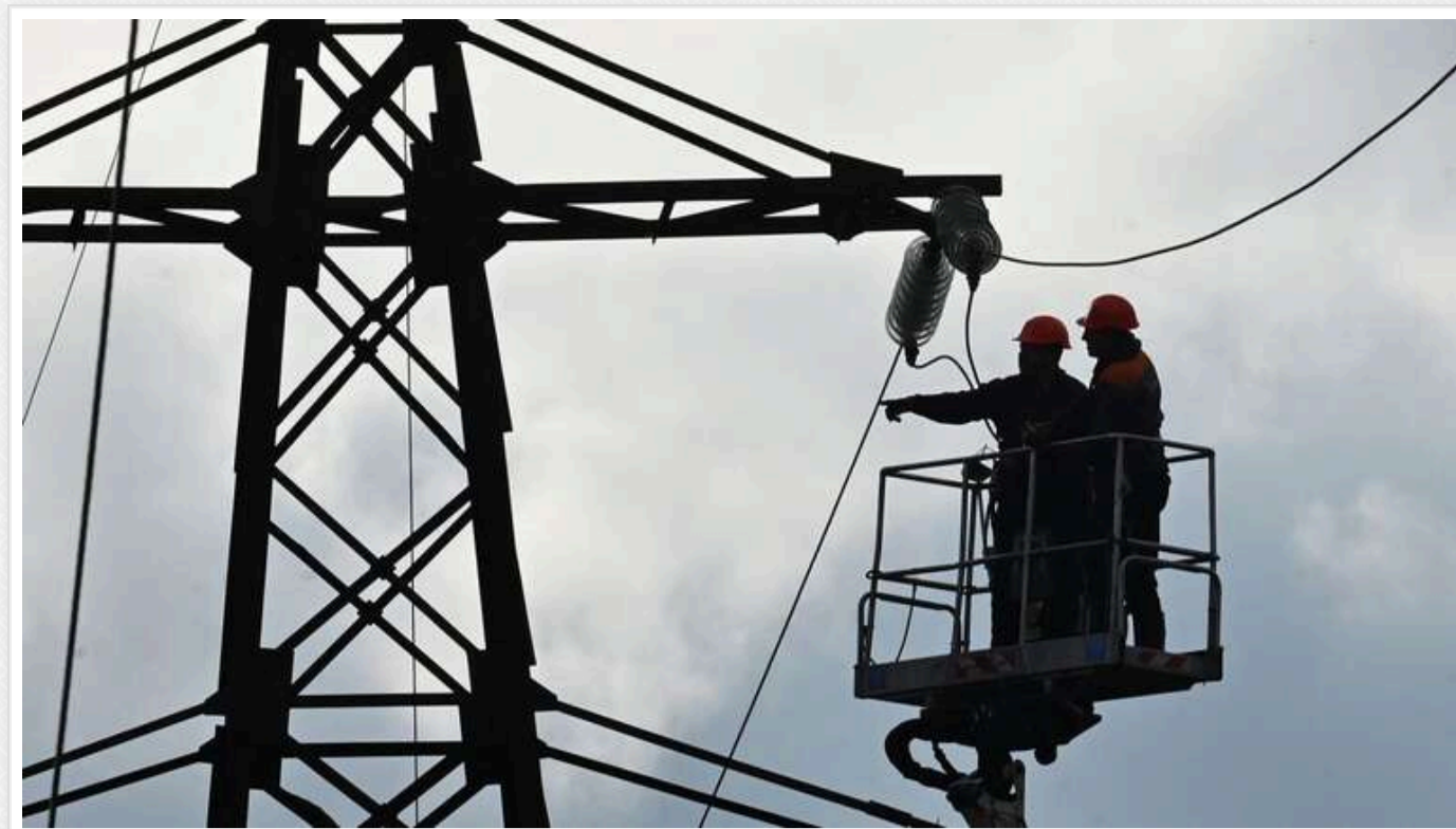
Рівненська область частково знеструмлена через атаку дронів

Часткове знеструмлення двох областей України сталося у четвер, 7 листопада, через атаку дронів. Йдеться про Житомирську та Рівненську області.