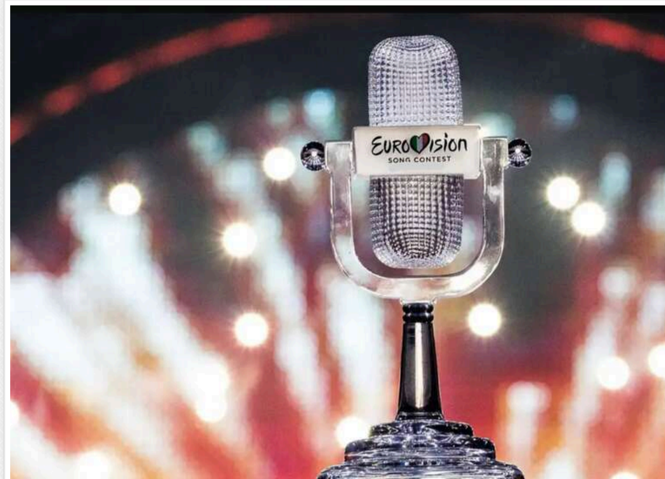
Україна планує витратити майже 11 мільйонів гривень на нацвдбір на «Євробачення-2025»