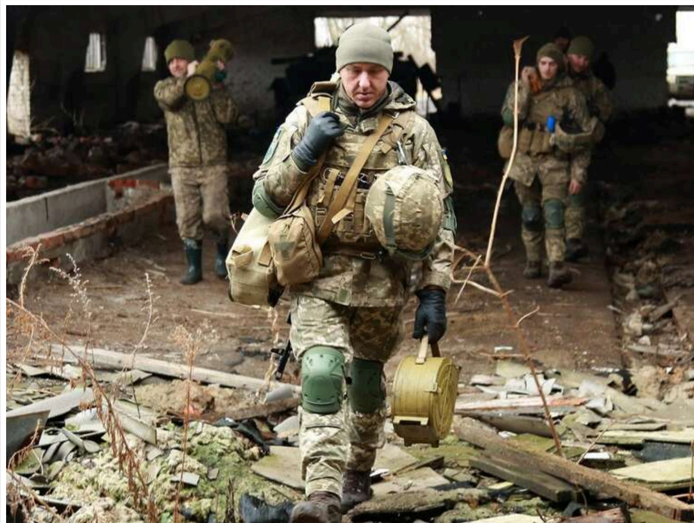
На Заході вважають, що Україна "повільно програє війну", - FP

У НАТО та західних країнах впевнені, що Україна "повільно програє війну".