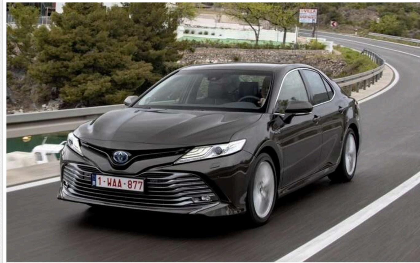
У Полтаві поліція охорони за 2 мільйони купила гібридну Toyota Camry в найвищій комплектації

Управління поліції охорони в Полтавській області 4 листопада за результатами тендеру замовило ТОВ «Компанія «Стар Лайн» автомобіль за 2,06 млн грн.