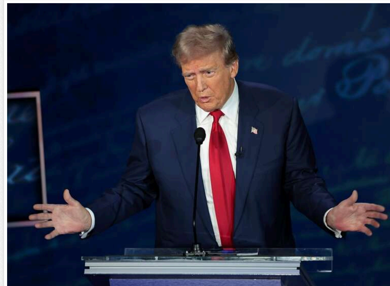
Вибори в США: фондові індекси Dow Jones і S&amp;P 500 рекордно злетіли

Ф'ючерси, пов'язані з індексами S&P 500 і Dow Jones, досягли рекордних висот після того, як Дональд Трамп заявив про повернення на пост президента США. Водночас китайський юань і фондові ринки Китаю різко знизилися, оскільки перспектива нового президентства Трампа й контролю республіканців над Конгресом США загрожує посиленням напруженості між країнами.