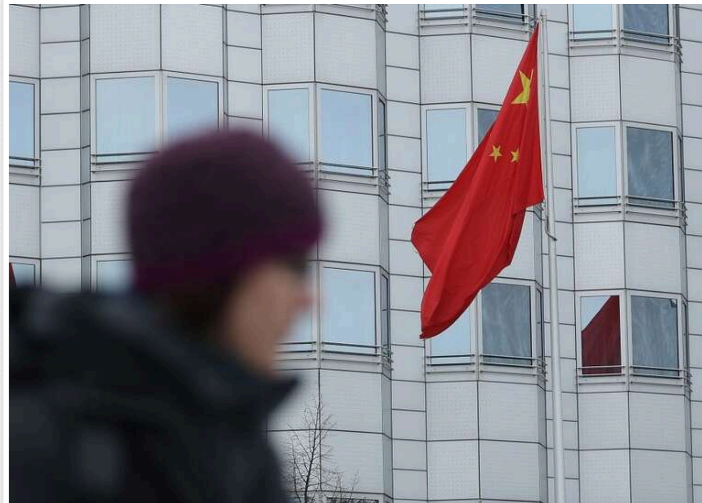
The Guardian: Китай хвилюється через відправку військ КНДР до Росії

У Китаї стурбовані тим, що участь КНДР у війні проти України на боці РФ може мати небезпечні наслідки, загрожуючи позиціям самого Китаю в Азії та об'єднуючи супротивників КНР проти неї.