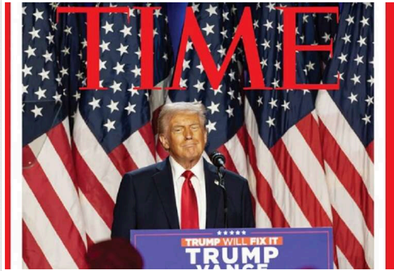
У Time назвали перемогу Дональда Трампа "вироком американському народу"

Американський журнал Time розмістив на обкладинці наступного випуску фотографію кандидата від республіканців Дональда Трампа, який здобув перемогу на виборах президента США-2024.