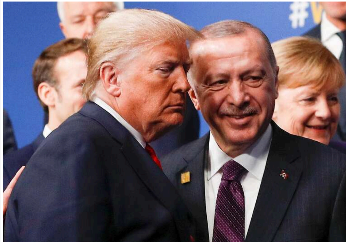
Ердоган назвав Трампа другом після його перемоги на виборах

Президент Туреччини Реджеп Тайїп Ердоган передав привітання Дональду Трампу з перемогою на виборах президента в США.